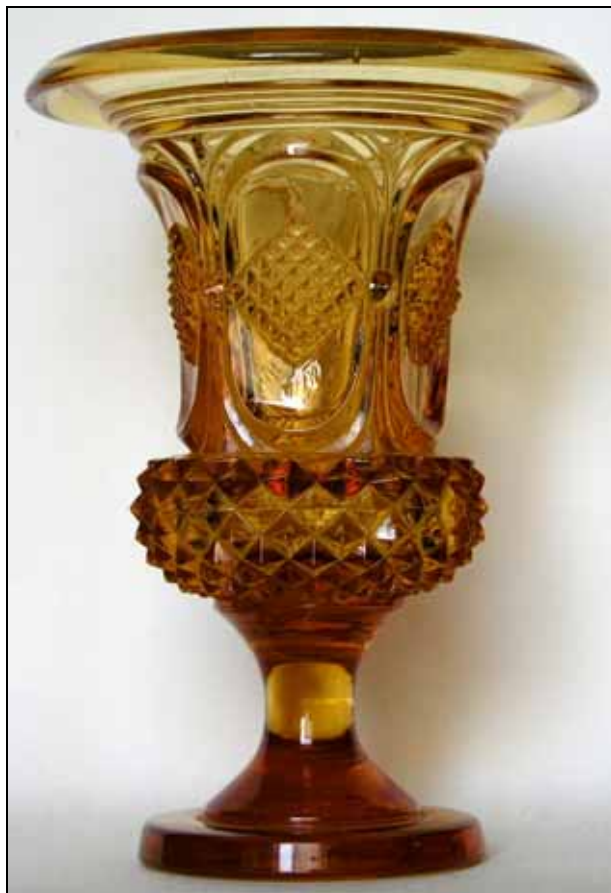
Abb. 2009-2/006 Vase mit Rauten und Diamanten Fuß mit flach ausgekugelmtem Abriss bernstein-farbiges Pressglas, H 18 cm, D oben 12 cm D Fuß 7,5 cm, Gewicht 665 g Sammlung Schaudig s. MB Launay & Hautin, um 1840, 2. me Partie: Planche 26 Vases Médicis, No. 1396 (6) S t . L. (St. Louis), m. à lozanges de diamants - culot diamants biseaux