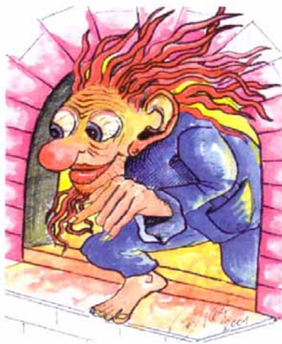
Abb. 2009-2/318 Durandl, Alfred Kraft, Spiegelau aus Steger, Durandl 2009, S. 17

Wurden nun die Hafens, die Vorsetzer und die Schmelzkuchen getempert, so konnte man nach dem Brennen am neuen Ofen die Fußspuren des Durandl erkennen. Für den Schmelzer und die Glasmacher war dies ein gutes Omen für reines Glas und beste Glasmacherproduktion. Nun konnte in der Glashütte wieder eine gute Zeit beginnen. Viele der Glasmacher kamen wieder in ihre alte Hütte zurück und das gewohnte Lärmen und Singen in der Glashütte war wieder weithin zu hören.