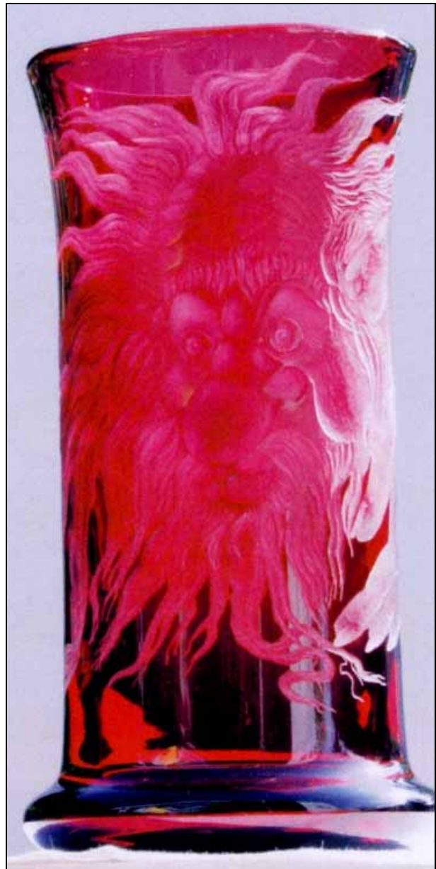
Abb. 2009-2/320 Vase mit dem Glashüttengeist „Durandl“ Gravur Christin Schmidt, Rabenstein aus Steger, Durandl 2009, S. 50

„Feuerweiß“ wurde vom Glassortierer als Glasfehler eingestuft und schmälerte den Inhalt der Lohntüte der Glasmacher.