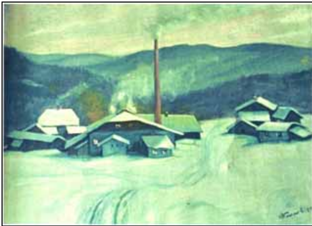
Abb. 2009-2/319 Seebachhütte - Reinhold Koeppel, Waldhäuser aus Steger, Durandl 2009, S. 24

Die Generatorgasflamme erzeugte im Ofenraum eine sehr lange, sich langsam bewegende Flamme, mit vielen Feuerzungen, die um die Häfen leckten. Auch hier hatte man beim Blick in den Ofenraum das Gefühl, als ob sich ein Geist darin bewegen würde - natürlich der Durandl!