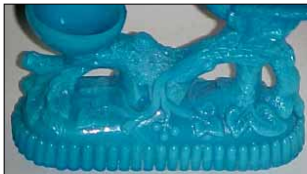
Abb. 2006-2-03/032 MB Bayel & Clairey Prix-Courant 1887, Seiten 24-25, Planches 52-58, Coupes moulées suite, Corbeilles moulées, Paniers...