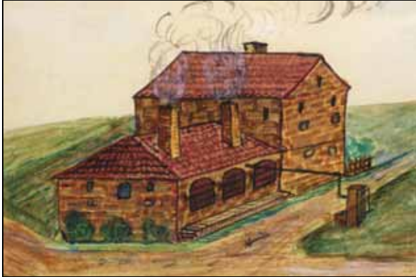
Abb. 2009-4/310 Fabrikschleichach, Glashütte Neumann Glashütte, Aquarell von Vinzenz Heil, 1933 Fundamente der Glashütte, entdeckt 1993 aus Heimatpflege in Bayern, Schriftenreihe des Bayerischen Landesvereins für Heimatpflege e.V., Band 2, 2009, S. 37

welches Besucher der Keramikwerkstatt auch kulinarisch verwöhnt. Zudem hat sich die Werkstatt als regelmäßiger Veranstaltungsort für Konzerte, Ausstellungen und Vorträge etabliert. [...] http://www.keramik-im-steigerwald.de/sites/02m_werkstatt.html