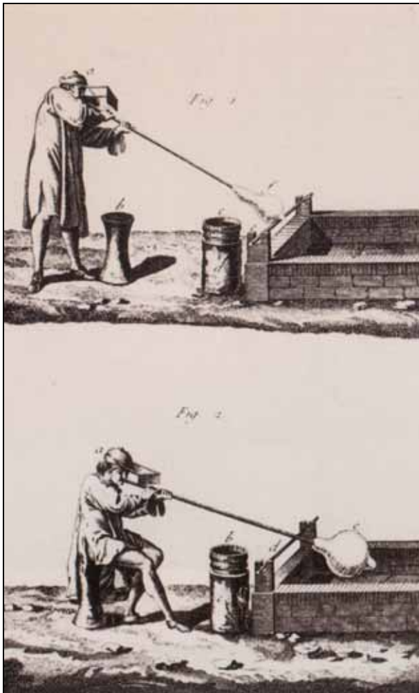
Abb. 2009-4/309 Mondglasherstellung Encyclopedie von d'Alembert und Diderot, 18. Jhdt. aus Heimatpflege in Bayern, Schriftenreihe des Bayerischen Landesvereins für Heimatpflege e.V., Band 2, 2009, S. 36