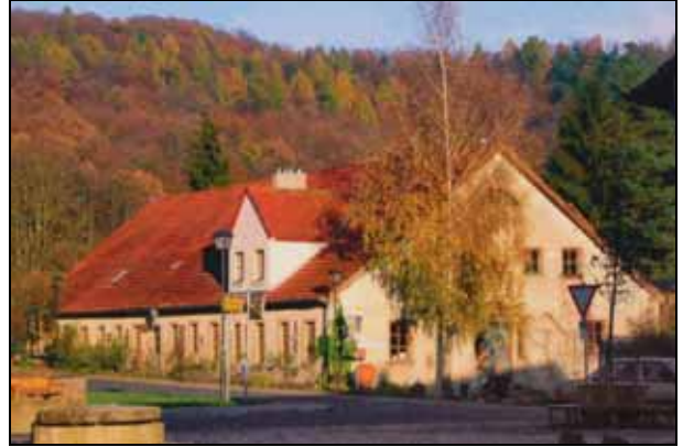
Abb. 2009-4/311 Fabrikschleichach, Glashütte Neumann Ehemalige Pottaschesiederei, heute Keramikwerkstatt Häuser der ehemaligen Glasbläsersiedlung aus Heimatpflege in Bayern, Schriftenreihe des Bayerischen Landesvereins für Heimatpflege e.V., Band 2, 2009, S. 37

führt. http://www.ale-unterfranken.bayern.de/ ... publikationen/34898/linkurl_10.pdf