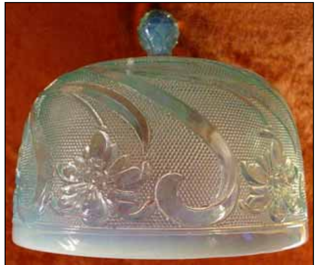
Abb. 2002-4-1/006 (Ausschnitt)

Mit diesen Maßen denke ich eher an eine Butterglocke, für eine Käseglocke wären die Maße wahrscheinlich doch etwas größer.