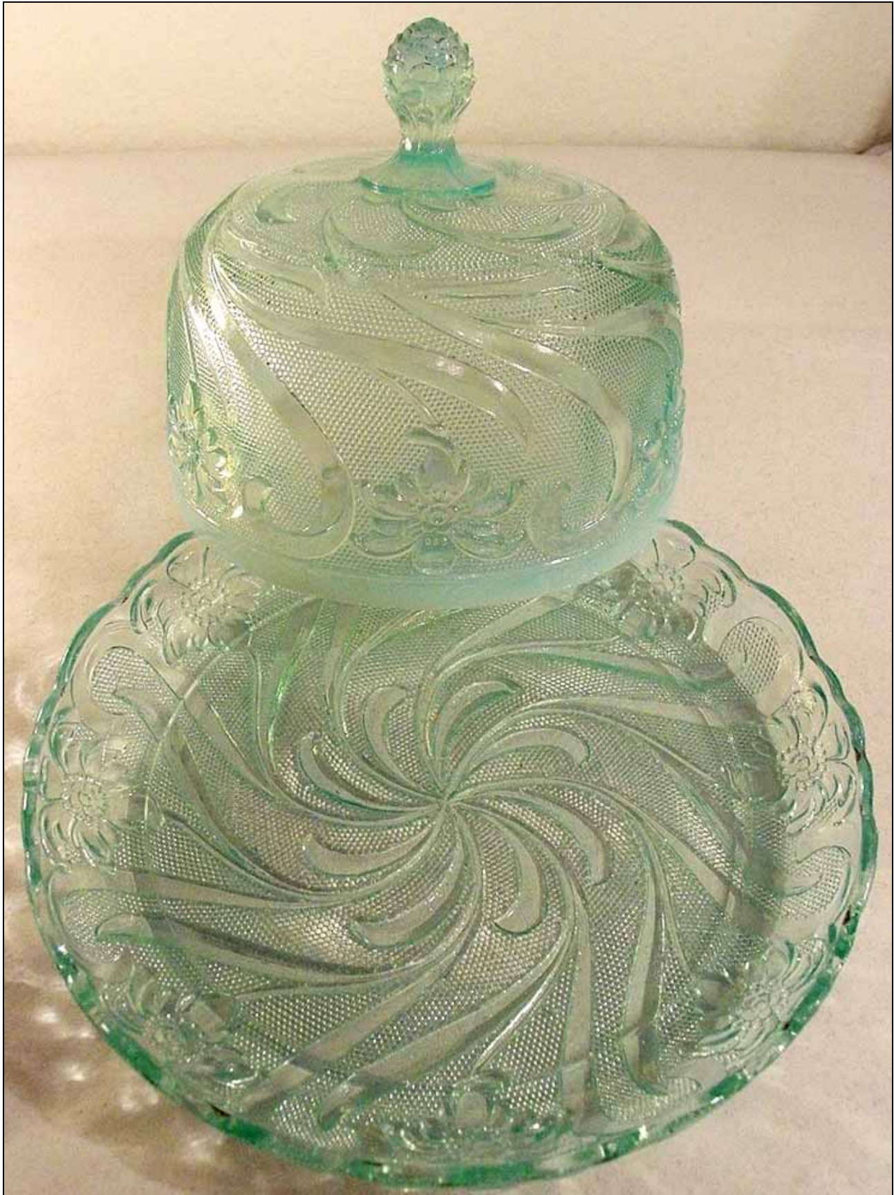
Abb. 2010-1/194 (Maßstab ca. 85 %) Butterglocke mit Teller, Edelweißblüten und -blättern farbloses, opalisierendes Pressglas, H Glocke mit Knauf 13 cm, D Teller 20 cm, D Glocke 14,5 cm Sammlung Tschäppät vgl. MB Inwald 1914, Tafel o.Nr. Muster „Edelweiß“, Nr. 6502