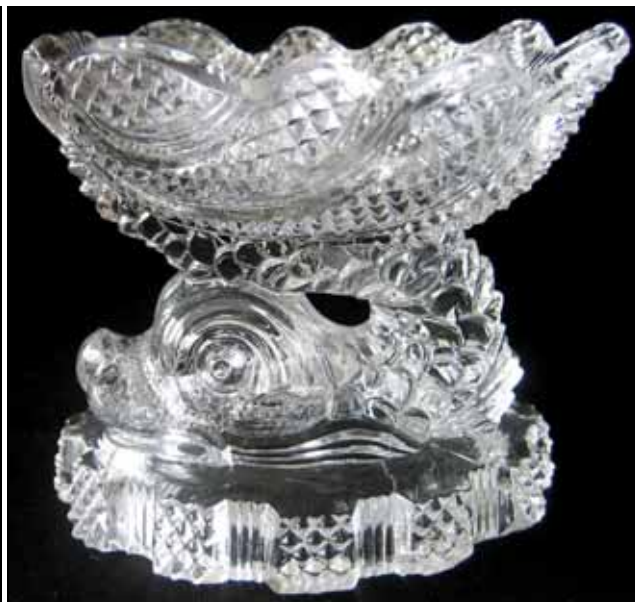
Abb. 2010-4/031 (Maßstab ca. 120 %) Salzgefäß mit Muschel und Delphin, „Salières Coquille m. à diamants et filets“ farbloses, gepresstes Bleikristallglas, H 6,5 cm, B 5,5 cm, L 7,2 cm, Sammlung Vogt, PV-1509 s. MB Launay, Hautin & Cie. um 1840, Planche 17, No. 1208 B., Baccarat, um 1830/1831