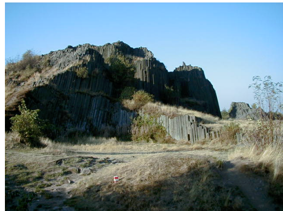
Herbst 1999

Basaltfelsen „Pánska skála“ an der Landstraße von Kamenický Šenov [Steinschönau] nach Prácheň [Parchen]