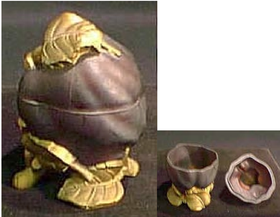
Abb. 02-2000/255 Deckeldose in Form eines Apfels mit Blättern (oder eine Quitte?) schwarz (?)-opakes Glas, Blätter mit Kaltvergoldung aus einer Auktion im INTERNET von alando/ebay, Feb. 2000 vgl. Musterbuch Vallérysthal & Portieux 1908, Folio 303, Nr. 3765, aus Chiarenza 1998, S. 209