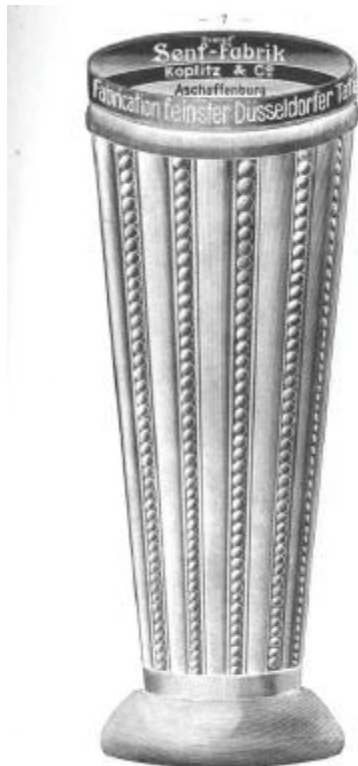
Abb. 2003-2-14/010 Musterbuch Koplitz 1908, Tafel 7, Nr. 281, Selma-Tulpe