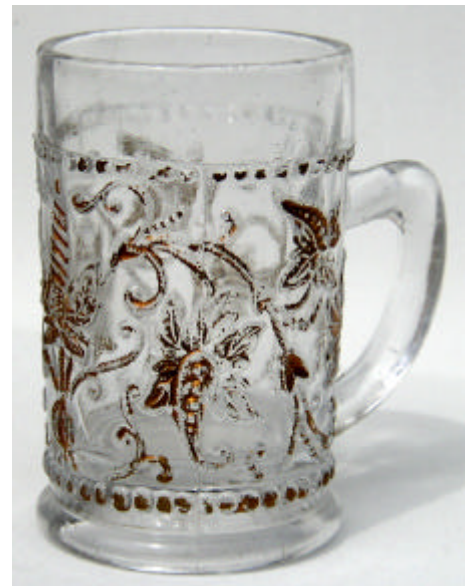
Tafel 5, Nr. 274, Reifenhenkel, nicht abgedruckt