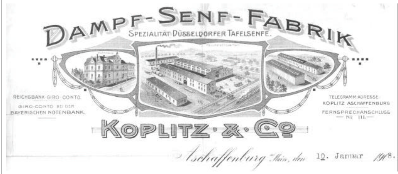
Abb. 2003-2-14/004 Musterbuch Koplitz 1908, Anschreiben, Ausschnitt Bilder der Firmen-Gebäude: Wohnhaus, Hauptetablisement, Lagerhallen

Die Gläser sind in den beiden Musterbüchern Koplitz 1908 weitgehend identisch.