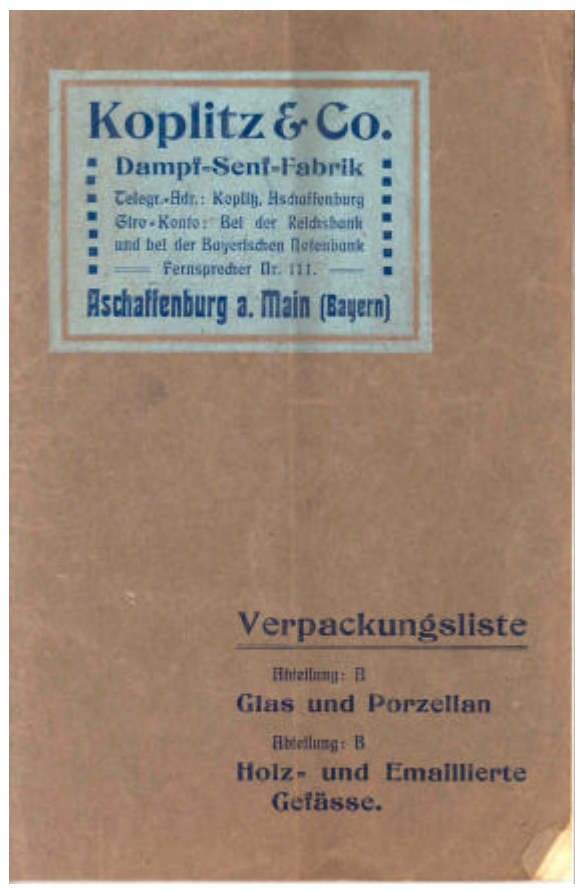
Abb. 2003-2-14/001 Musterbuch Koplitz 1908, Einband 1

Koplitz & Co. Dampf-Senf-Fabrik Telegr.=Adr.: Koplitz, Aschaffenburg Giro=Konto: Bei der Reichsbank und bei der Bayerischen Notenbank Fernsprecher Nr. 111 Aschaffenburg a. Main (Bayern) Verpackungsliste Abteilung: A Glas und Porzellan Abteilung: B Holz- und Emaillierte Gefässe.