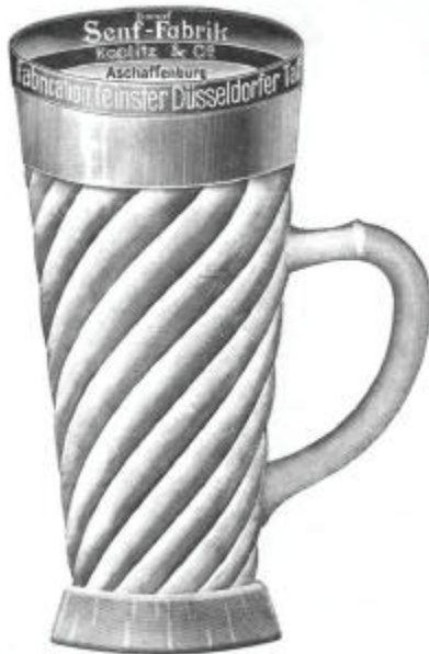
Abb. 2003-2-14/009 Musterbuch Koplitz 1908, Tafel 6, Nr. 275, Rollenhenkel Sammlung Neumann