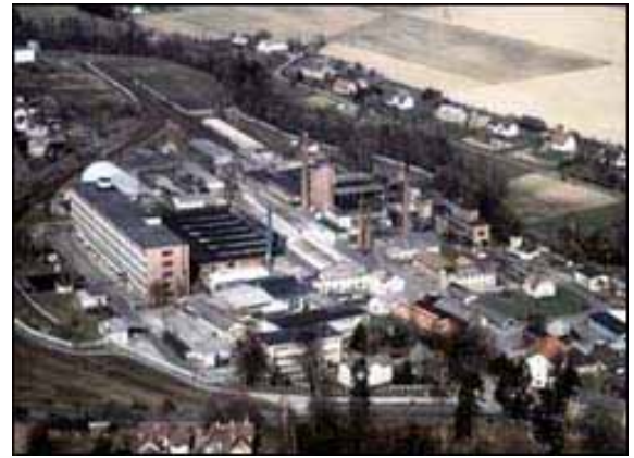
Abb. 2002-2/113 Glaswerke Rapotínské sklárny, a.s., Rapotín, Kr. Šumperk

Die Glashütte Rapotín produzierte zunächst Flach-, Nutz-, farbloses und farbiges Glas. Es gab auch eine Schleiferwerkstatt im Schlosspark [ www.sklarny.cz/history-de.html ]. Die Glaswerke Rapotínské sklárny, a.s. fertigten zuletzt Beleuchtungsglas. Sie existierten noch 2003, gingen aber Mitte 2002 zusammen mit dem Glaswerk Osvětlovací sklo in Krásno / Valašské Meziříčí, ehemals S. Reich & Co., Wien - Krásno, in Konkurs.