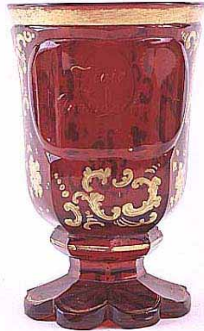
Abb. 2002-4/311 Fußbecher, Kat.Nr. 649 rotes Glas, geschnitten, vergoldet, H 14,1 cm Medaillon m. Inschrift „ŽIVIO GROMOVITO“ Hersteller unbekannt, Kroatien, Mitte 19. Jhdt. Sammlung Zagreb, Hrvatski povijesni muzej, HPM/PMH 25193