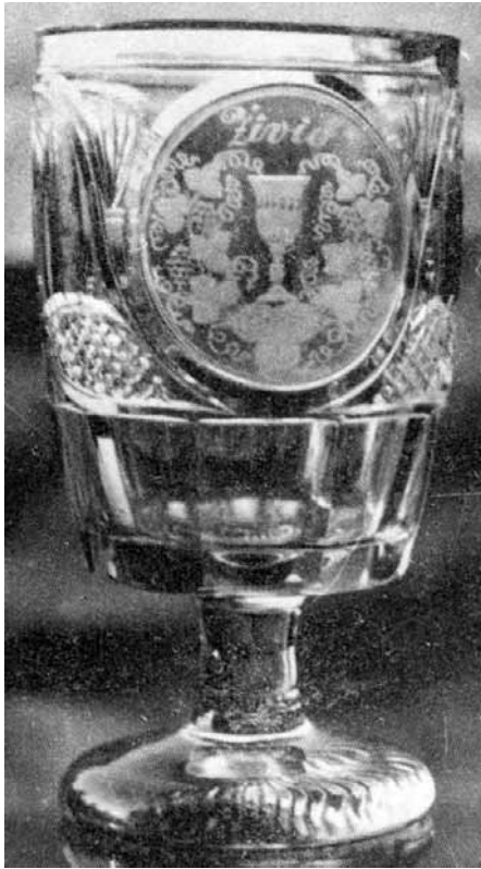
Abb. 2005-2-08/004 Fußbecher, überfangenes (?) und geschliffenes Kristallglas Glashütte Osredok, um 1880

zenberg usw. Der Glasmacher kam aus dem abgeschlossenen Leben in Waldestiefen nunmehr in die lichte Natur, kam vom Almengebiet herab in die Niederung, fand Anschluss an Schule und Vereinstätigkeit und damit ließ er sein Ohr einer neuen Lehre, die von London her kam und von Karl Marx begründet wurde. Aus dem Glasgesellen wurde der Glasmacher, aus dem Glasmeister der Hüttenherr; vorbei die Zeit, da ein verarmter Adeliger ohne Minderung seines Ansehens zweierlei tun durfte: Goldschmiedarbeit zu leisten oder die „Glasblaserey“ zu üben. Aus dem „Herrn Vater“ wurde so der „Herr Chef“; er stieg in der sozialen Schichtung noch höher, der Glasmacher sank.