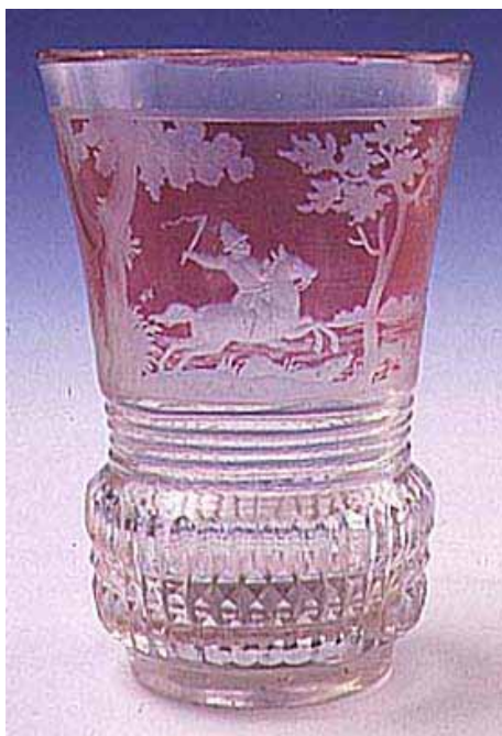
Abb. 2002-4/310 Becher, Kat.Nr. 635 farbl. u. rosa-farb. Glas, geschnitten, graviert, H 12,9 cm Jagdscene Osredek, Kroatien, ca. 1850 Sammlung Zagreb, Muzej za umjetnost i obrt, MUO 14757