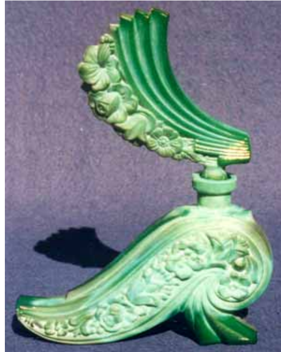
Abb. 2005-3/xxx Flakon mit Stöpsel, Blumen-Dekor opak-jade-grünes Pressglas, H 19,8 cm Sammlung Stopfer Hersteller unbekannt, ČSSR, 1980-er Jahre vgl. MB Schmidt 1939, Tafel 153, Nr. 4834/962/1

um Gläser für den Export vor allem in die USA zu fertigen.