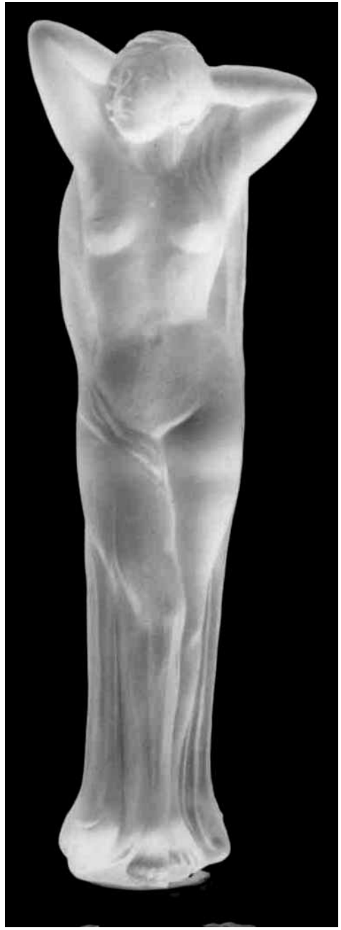
Abb. 2005-3/xxx Weiblicher Akt als Stöpsel eines Flakon farbloses, mattiertes Pressglas, H 20 cm (ohne Stopfen) Sammlung Stopfer vgl. MB Schmidt 1939, Tafel 76, Stöpsel Nr. 804 Hersteller unbekannt, Schmidt 1939? ČSSR, 1980-er Jahre?

In der Bibliothek des Kunstgewerbemuseums in Prag gibt es eine unvollständige Ausgabe dieses Musterbuches Josef Schmidt, Unter-Polaun. Der Katalog des Museums besteht aus den Tafeln 109 - 162, der Einband fehlt. (Der vollständige Katalog besteht aus den Tafeln 1 - 162, wovon die Tafeln 125, 126, 137, 138, 139, 140 fehlen.) Auf den Tafeln 109, 119, 133 und 149 stehen die Inventarnummern C 18591/2 und 2544/88 und der Stempel „UMĚLECKOPRŮMYSLOVÉ MUZEUM V PRAZE, KNIHOVNA“. Im Anhang ist eine Preisliste vom 1.5.1946 in KčS [Kronen] beigefügt. Nach Auskunft des Museums soll es sich um einen Katalog der