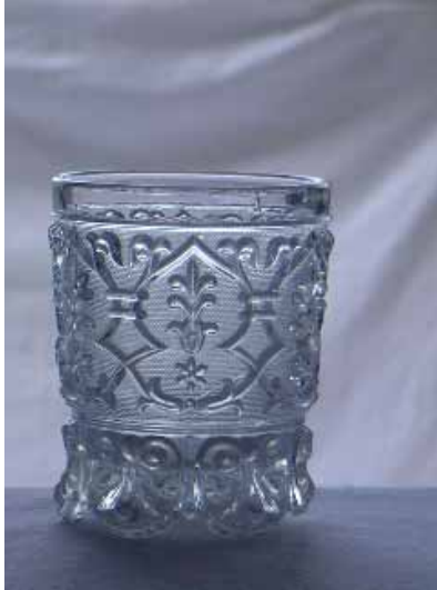
Becher 10 cm hoch, Bleikristall. Man kann es ansetzen für 1840-50. Das darf man auch für die beiden anderen gelten lassen.

Als im 19. Jahrhundert mit gepresstem Glas experimentiert wurde, zuerst wohl in Amerika, dann in England, dann erst um die Vierziger Jahre auf dem Kontinent, da explodierte eine Technik, die vorher schon lange eine beliebte war: das Blasen der Glasmasse in vorgefertigte Formen. Nur hatte man bis dahin häufig Holzformen benutzt, die nicht gerade sehr differenziert zu bearbeiten sind und trotz ihrer Durchfeuchtung mit Wasser zudem nach einer gewissen Nutzzeit verbrannt waren. Nun aber verstand man es, parallel zur Entwicklung der Eisengusstechnik, mehrteilige Eisenformen zu schaffen, die höchst differenzierte Oberflächen zuließen.