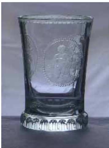
„Powolny“-Glas: Konisch aufsteigende Becherform, 13 cm hoch. Drei Medaillons auf klarem Grund: Traubenernte, Cellospieler, Weintrinker.