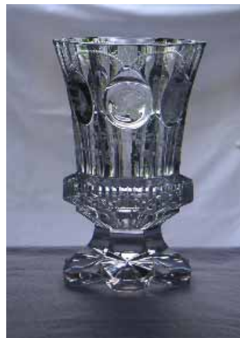
„Henriette Grün“ Glas, 14 cm hoch, Fuß, sechspassig tief ausgeschliffen, das kurze Schaftstück facettiert. Die konisch aufsteigende Kupa mit sechsfacher Schälung und zartem Schnitt.