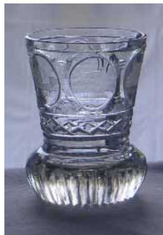
„Mariaschein“: ein Glas, vielleicht aus Teplitz, denn auch „Dux“, die Nachbarstadt von Brüx, erscheint in einem der Medaillons.