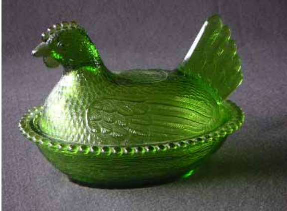
Das Chamäleon der Margit M.Tóth

Das gepresste Glas machte halt auch wirklich alles möglich.