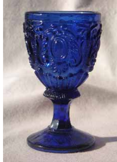
Blaues Fußglas aus Deutschland, 11 cm hoch (Christiane Sellner, „Glas in der Vervielfältigung“, S. 77).

Man hat lange gerätselt, wie man denn bei dem gepressten Glas auf das so viel verwendete „Sablée“ gekommen sei. Es hebt sicher die glatt gebliebenen Stege, Flächen, floralen Formen sehr hervor - aber würden sie nicht durch den in verschiedenen Winkeln erfolgenden Lichteinfall auch so leuchten? Irgendwann hört die Oberflächenbehandlung durch das Sablée auch auf. Ich habe irgendwo eine erstaunliche, aber auch einleuchtende Erklärung gelesen: Die ersten Hersteller von eisernen Gussformen seien geschult gewesen an den Oberflächen von Rüstungen, und so hätten die Formgießer auch für die Glasmacher gearbeitet.