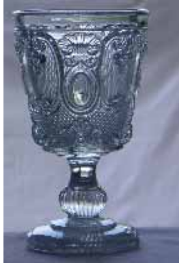
Fußglas (im Albert- und Victoria-Museum), 14 cm hoch mit der Provenienz „Baccara“ (auch PK 1/02. S. 22, Abb. 017).