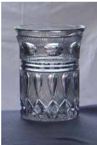
Kaliglas-Becher, 11 cm hoch, zylindrische Wandung, am oberen Rand ausgestellt, in mehreren Zonen geschliffen, der größere untere Teil mit Steinlung und lanzettförmigen Klarflächen, in der oberen Zone Kugelfries auf Senkrechtband.

Ich stelle mit meiner Sammelei auch ein Stück Vergangenheit wieder her, das Regal mit blauen Gläsern in der Küche, die guten Stücke im „Servan“ des Esszimmers.