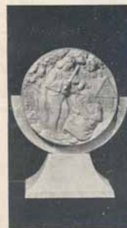
1519. Reliéfne rytá kř. plaketa Kde domov můj dle návrhu prof. L. Přenosila. S nápisem na spodním okraji zasazena v černém skle nebo mramoru. Určeno pro nejvánošnější. Kės 3.200.—. Dle přání možno zasadit do etue