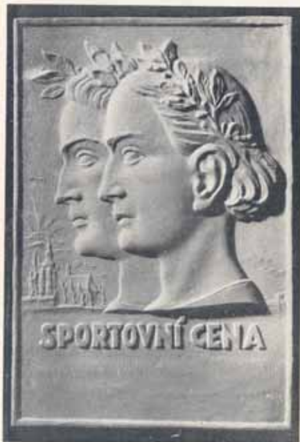
1508. Vítězná křehalú plaketa, reliefně rytá, s nápisem na spodní části plakety, dle návrhu prof. Přenosila, Kės 1.250—, možno zasadit do etne se sametovým vyložením za Kės 200—, 26,5 cm x 17,5 cm