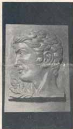
1516. Plaketa z kř. skla reliéfne rytá, 13,5x11,5 cm. Kės 350.—, věnování na spodním okraji, kasety Kės 80.—. Dle návrhu prof. L. Přenosila