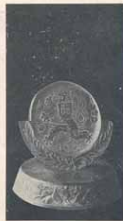
1517. Plaketa z kř. skla reliéfne rytá, Ø 7 cm, výška 11 cm. Kės 135.—, zasazena v umělecky řezaném podstavci s odbohem listových hřstů. Věnování na druhé straně plakety