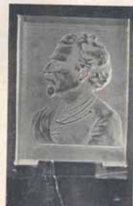
1513. Plaketa Tyrše, reliefně rytá z křehalového skla, výška 20 cm, šířka 11,5 cm, zasazená v mramoru neb černém skle, Kės 400—, podstavec 150—

Dr. Miroslav Tyrš war Gründer der tschechischen Turn-Bewegung