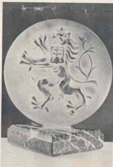
1509. Plaketa z křehalového skla s reliefně rytým znakem, zasazená do hrůšeného onyxu, výška 18,5 cm, šířka 14,5 cm, navrhl prof. Pazourek, Kės 500—, podstavec 80—