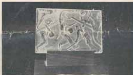
1518. Reliéfne rytá sportovní plaketa, zasazena v leštěném dřevě, výška 14, šířka 14,5 cm. Kės 280.—