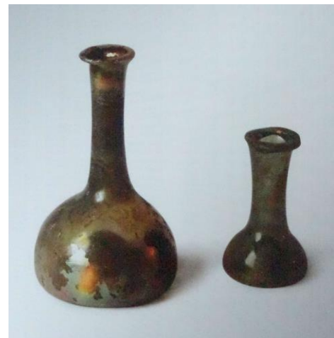
Blätterchen aus: Klaus Vohn-Fortagne, Glashütten in der Deister- Süntel-Region, Entstehung und Geschichte, Hannover 2015

Ein wahrer Boom kleiner Glasflaschen für den persönlichen, häufig nur einmaligen, Gebrauch für Jedermann begann erst mit dem viktorianischen Zeitalter in der zweiten Hälfte des 19. Jahrhunderts. Aufgrund von technischen Erfindungen konnten Glasflaschen jetzt preisgünstiger hergestellt und für bestimmte Zwecke auch mit erhabener Prägung versehen werden. Die wirtschaftspolitischen Voraussetzungen, die sich in dieser Zeit herausbildeten, führten zu einer massenhaften Nutzung und zur weltweiten Verbreitung dieser Fläschchen. Darauf wird später noch genauer einzugehen sein. Aus Fläschchen dieser Epoche setzt sich meine Sammlung zusammen.