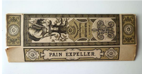
Verpackung von Dr. Airys Pain Expeller