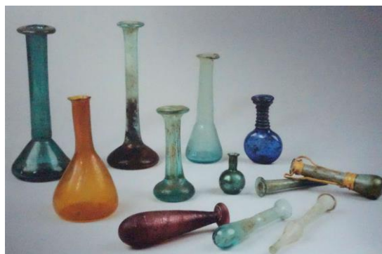
Kleine Glasflaschen für Salben und Parfüm 1. – 3. Jahrhundert n.Chr. Römisch-Germanisches Museum der Stadt Köln

Die Römer brachten kleine Glasgefäße in die entlegensten Militärstandorte ihres riesigen Reiches, so dass wir sie heute als Bodenfunde sowohl in Israel als auch in Köln und sicher auch am Hadrianswall in Nordengland finden können. Die feinen Römerinnen trugen ihre kostbaren Kosmetika in sog. „Balsamarien“ mit sich in die Badehäuser. 2