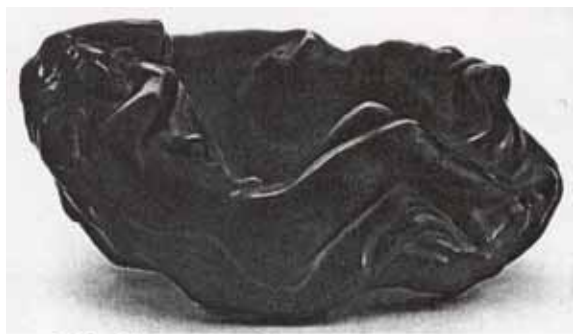
222. Vide-poches «Nu couché dans la vague»

Abb. 2003-4/197 Cappa 1998, Abb.Nr. 222, Schale mit Frauenakt und Woge nicht Henry G. Schlevogt „Ingrid“, 1934-1945 Halama Art.Nr. 1944 / 32011