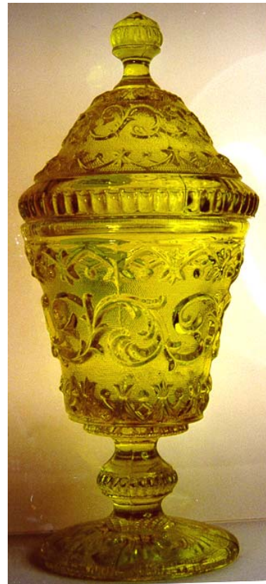
Abb. 2001-5/024 Becher mit Fuß u. Deckel, Ranken auf gekörntem Grund gelbes Glas, H 13,5 (ohne Deckel) cm, D 9,2 cm Sammlung Geiselberger, PG-258

Ein neuer Leser der Pressglas-Korrespondenz hat im Mai 2001 ohne die bisherigen Berichte zu kennen, die „Story“ bis in typische Details ebenfalls gekannt und wiedergegeben.