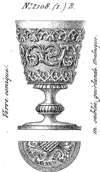
Abb. 2001-5/023 Becher mit Fuß, Ranken auf gekörntem Grund, Boden rund, Boden unten m. Ranken u. Diamanten MB Launay & Hautin 1840, Planche 65, Nr. 2108 B (Baccarat) „Verre conique m. sablée, guirlande arabesque“ vgl. Becher mit Fuß, Ranken auf gekörntem Grund gelbes Glas, Sammlung Geiselberger, PG-258

Eine andere Sammlerin berichtete: „Ich habe das Gefühl, dass in den letzten zwei Wochen im Juni 2000 speziell der Berliner Antikmarkt auf dem 17. Juni mit Reproduktionen regelrecht überschwemmt wird. Ich habe in der vergangenen Woche auf dem besagten Markt einen Stand gesehen mit so viel opak blauem & schwarzem Pressglas (Schalen, Fußbecher usw. nach Dekoren bis spätestens 1920, ohne jegliche Abnutzungs-Erscheinungen, wie frisch aus dem Ei gepellt), dass mich das zugegeben ziemlich verunsichert hat. Laut Angaben des Händlers hat er sie vor etwa 20 Jahren bei seinem Umzug aus Stuttgart nach Berlin mitgebracht und „mag“ sie nun nicht mehr. Das muss purer Unsinn gewesen sein, da er schätzungsweise Mitte dreißig war und es unwahrscheinlich ist, dass er als Jugendlicher vor 20 Jahren schon Pressglas gesammelt hat.“ [Klaudia