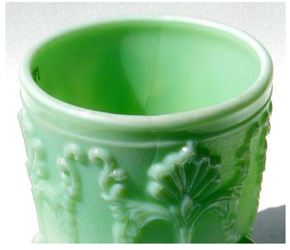
Abb. 2001-5/026 Becher m. Ranken-Dekor, hellgrün-opakes Glas der Riss vom ersten Bild von außen schwach erkennbar Herst. unbekannt, vermutl. CSSR / Tschechien, 1945-2000