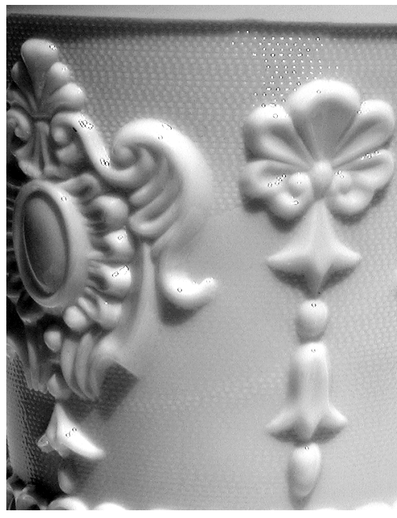
Abb. 2001-5/018 Becher mit Fuß barocken Rocailles, Oliven und Blüten-Blatt-Ranken auf gekörntem Grund, Ausschnitt weiß-opakes Glas, H 14,8 cm, D 7,9 cm Sammlung Geiselberger PG-599 Herst. unbekannt, vermutl. CSSR / Tschechien, 1945-2000

pen und einem angeblichen „König von Brasilien“. In Wirklichkeit handelt es sich um das Wappen von Portugal und einen nicht identifizierbaren Herrn in Uniform. Allerdings war der König von Portugal bis zur Flucht vor Napoleon 1808 einfach Besitzer, ab 1815 König und seine Nachkommen Dom Pedro I. und II. von 1822 bis 1889 Kaiser von Brasilien - eine unübersichtliche Geschichte, zugegeben!