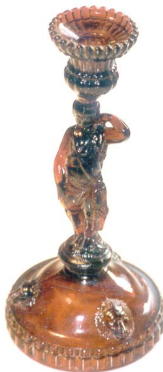
Abb. 2001-2/245 Leuchter, Dekor „Antiker Jäger“ goldrubin-farbenes Glas Sammlung Braun Imitation Herst. unbekannt, vermutl. CSSR / Tschechien, 1945-2000