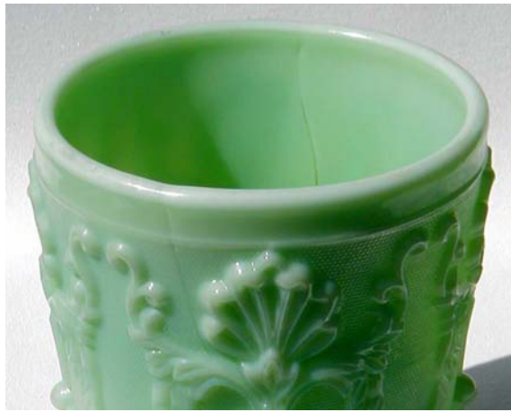
Abb. 2001-5/025 Becher m. Ranken-Dekor, hellgrün-opakes Glas 2 tiefe gegenüberliegende Risse in der Becherwand sie sind durch Verschmelzen von außen kaum erkennbar Imitation Herst. unbekannt, vermutl. CSSR / Tschechien, 1945-2000

Auf den vorhandenen Fotokopien mit Bildern von einem Teil der Gläser sind merkwürdigerweise die wenigen Angaben englisch: „HEIGHT“, die Maße aber deutsch / westeuropäisch angegeben: „cm“! Das deutet darauf hin, dass die Gläser tatsächlich für den Export in die USA gemacht wurden. (In Kanada existiert bisher kaum ein Markt für Pressglas und in England wird fast ausschließlich identifizierbares Pressglas englischer Glashütten gehandelt.)