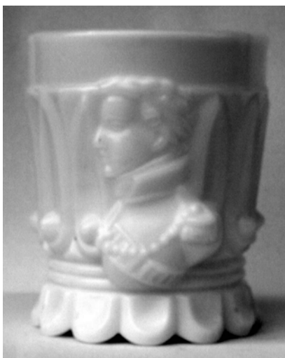
Abb. 2001-5/017 a/b Becher m. „König von Brasilien“ u. Wappen weiß-opakes Glas, H xxx cm Herst. unbekannt, vermutl. CSSR / Tschechien, 1945-2000

dem neu-gotischen Spitzbögen-Dekor [MB L&H 1841, Planche 87, Nr. 2667 B = Baccarat], der Fußbecher mit dem Neu-Rokoko-Dekor [MB L&H 1840, Planche 69, Nr. 2211 B], und der Fußbecher mit Ranken-Dekor [MB L&H 1840, Planche 65, Nr. 2108 B], finden sich tatsächlich in den Musterbüchern von Launay & Hautin. Beim Becher mit dem Ranken-Dekor gibt es aber in Einzelheiten deutliche Abweichungen zwischen dem Original und dem Replikat. Beim Becher mit den neu-gotischen Spitzbögen fehlt ein originales Vergleichsstück. In allen 4 Fällen sind die verwendeten Glasfarben für französische Originale der Zeit bisher unbekannt und nicht zeitgemäß. Sie stammen eher aus den oft geheim gehaltenen Mischkünsten böhmischer Glashütten, die seit dem Biedermeier eine ungeheure Vielfalt an Farben erfunden haben.