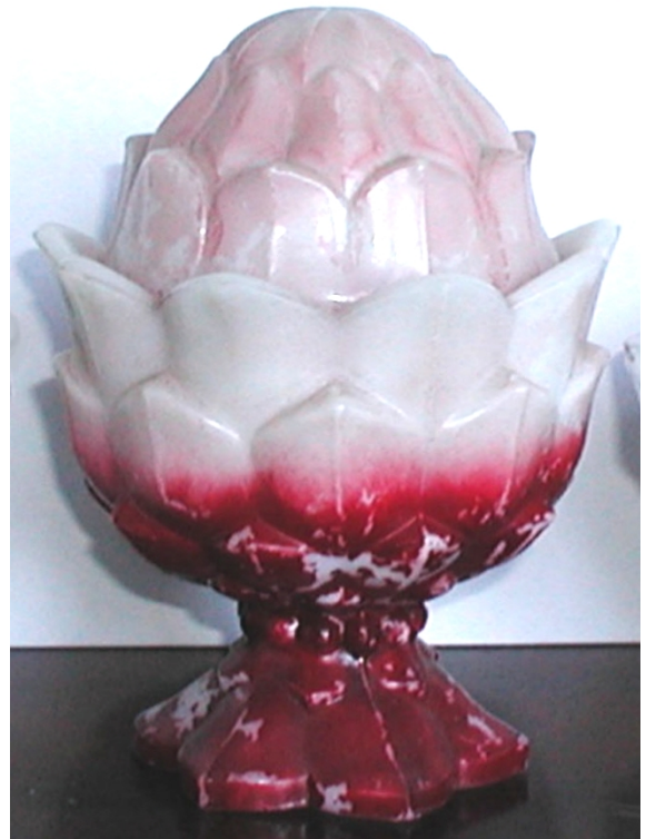
Abb. 2003-4/089 Deckeldose Artischocke opak-weißes Pressglas, kalt bemalt, H 14 cm, D 10 cm Sammlung Fehr Vallérysthal / Portieux, um 1900 s. MB Vallérysthal 1908, Pl. 305, Nr. 3775