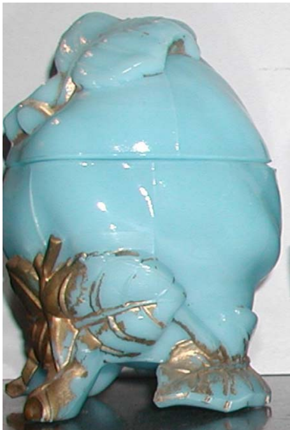
Abb. 2003-4/088 Deckeldose als Quitte (Apfel?) mit Blättern opak-hellblaues Pressg., kalt vergoldet, H 14,5 cm, D 10 cm Sammlung Fehr Vallérysthal / Portieux, um 1900 s. MB Vallérysthal 1908, Pl. 305, Nr. 3765