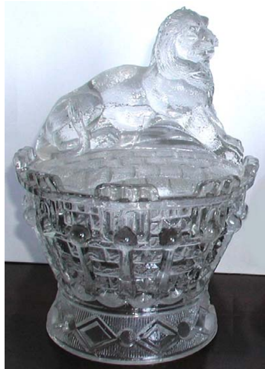
Abb. 2003-4/101 Deckeldose als Löwe auf einem Korb (?) farbloses Pressglas, H 19 cm, D 14 cm Sammlung Fehr s. MB Bayel / Fains 1923, Seite 97, Tafel 40, Nr. 1826 s. PK Abb. 2003-3/315