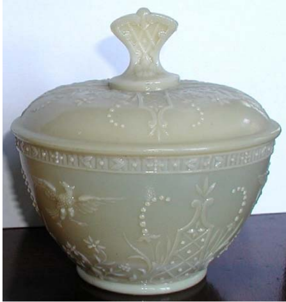
Abb. 2003-4/108 Deckeldose mit Adlern und Blüten opak-rosa-farbenes Pressglas, H 14 cm, D 14 cm Sammlung Fehr Val St. Lambert, Belgien, um 1900 s. Abb. 1999-3/101 MB 1913 Val St. Lambert, Planche 95, „Sucriers“