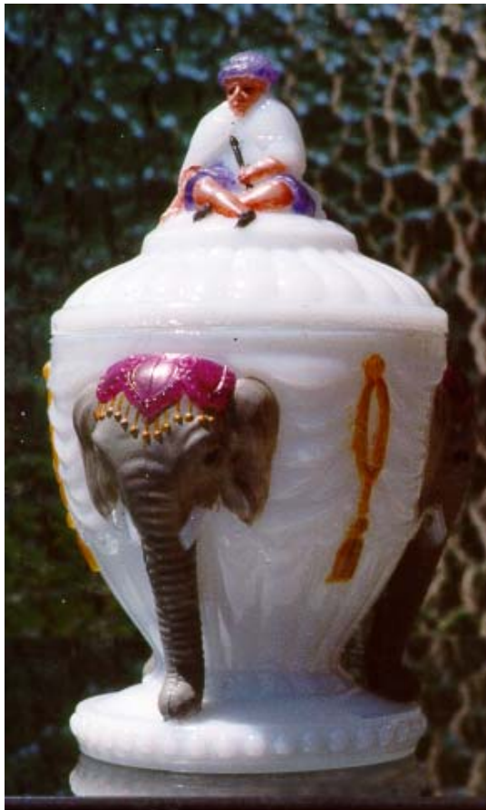
Abb. 2001-1/148 Deckeldose mit 3 geschmückten Elefanten und Mahout opak-weißes Glas, kalt bemalt, H xxx cm, D xxx cm Sammlung Roese HR 411 Hersteller unbekannt, um 1900