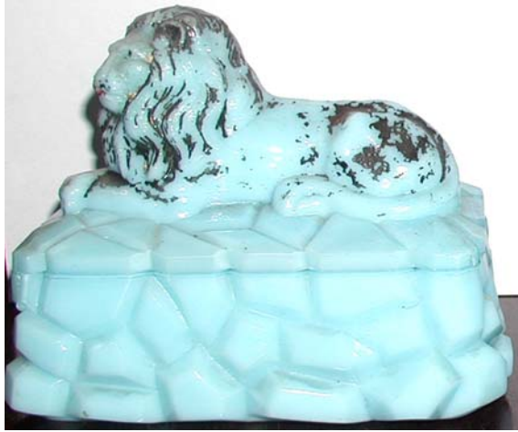
Abb. 2002-2-1/009 Schein-Deckeldose als Löwe auf einem Felsensockel hellblaues Pressglas, H 12 cm, B 9 cm, L 15 cm im hohlen Sockel eingepresste Inschrift „MEISENTHAL“ Sammlung Roese HR-328 nicht in den Musterbüchern Meisenthal 1907 und 1927 ent- halten soll vermutlich den „Löwen von Belfort“ darstellen