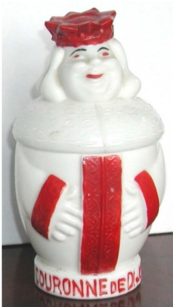
Abb. 2003-4/145 Senftopf als dicker König opak-weißes Pressglas, kalt bemalt, H 13 cm, D 7 cm Inschrift: „COURONNE DE DIJON“ [Krone ...] Sammlung Fehr Hersteller unbekannt, Frankreich, um 1900 s. Chiarenza 1998, S. 103, Abb. 222, opak-grünes Glas