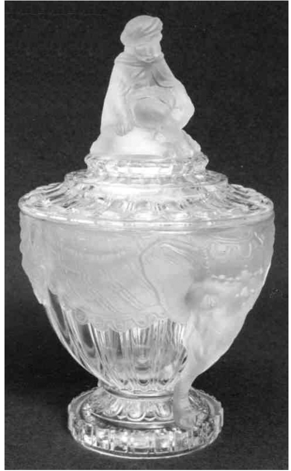
S. PK 2003-2, SG, Pressgläser in den Musterbüchern S. Reich 1880 und Baccarat 1893 - ein Rätsel? (Abb. 2001-04/357, MB Baccarat 1893, Tafel 66, Sucriers) u. PK 2003-2, Stopfer, Pressgläser zu den Musterbüchern von S. Reich & Co., Krásno und Wien (Abb. 2003-2/150)