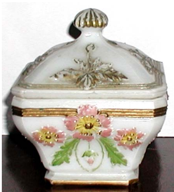
Abb. 2003-4/120 Deckeldose mit Blüten und Blättern opak-weißes Pressglas, kalt bemalt, H 12,5 cm, D 11 cm Sammlung Fehr Fenner Glashütte, um 1900 s. MB Fenner 1909/1910, Tafel 45, Nr. 362 „Wanda“ u. MB Fenner 1909/1910, Tafel 50, Nr. 402-405 „Wanda“