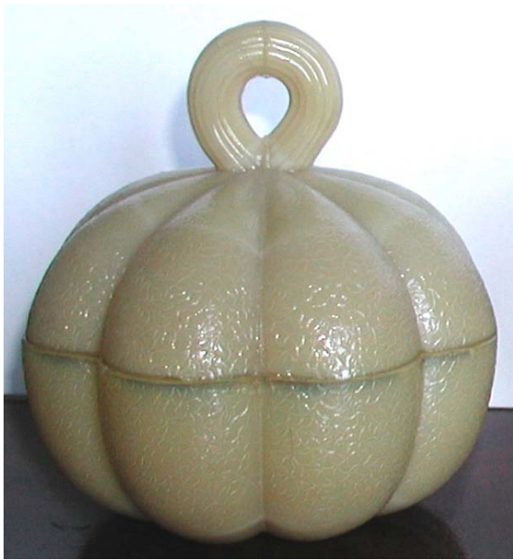
Abb. 2003-4/083 Deckeldose als Kürbis (Melone?) opak-hellbraunes Pressglas, H 12 cm, D 11,5 cm Sammlung Fehr Vallérysthal / Portieux, um 1900 s. MB Vallérysthal 1908, Pl. 304, Nr. 3762