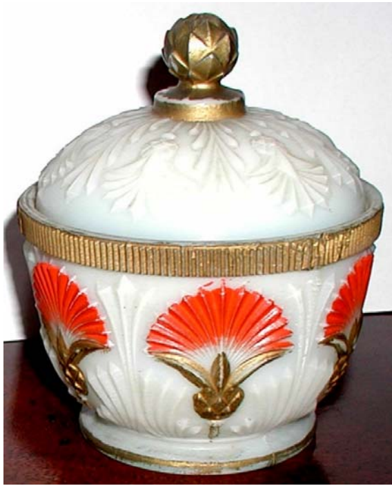
Abb. 2003-4/116 Deckeldose mit Distelblüten opak-weißes Pressglas, kalt bemalt, H 13,5 cm, D 11 cm (auch: opak-weißes Pressglas, H 12,5 cm, D 10,5 cm) Sammlung Fehr Vallérysthal / Portieux, um 1900 s. MB Vallérysthal 1908, Pl. 303, Nr. 3753