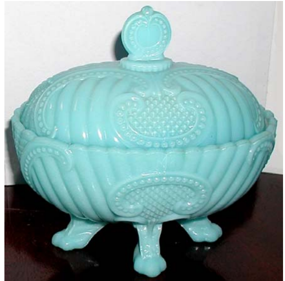
Abb. 2003-4/126 Deckeldose mit Rundrippen, Perlen und Diamanten opak-hellblaues Pressglas, H 13 cm, D 10 cm Sammlung Fehr Portieux, um 1900 s. MB Portieux 1894, Planche 185, Nr. 3475 „Ovale“