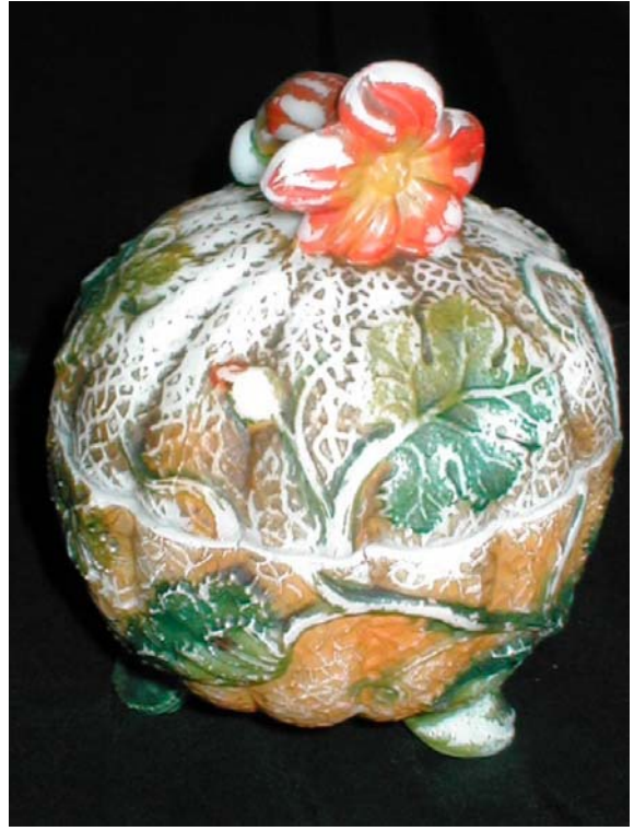
Abb. 2003-4/082 Deckeldose als Melone (Kürbis) mit Trompetenblüte, Blättern und Ranken opak-weißes Pressglas, kalt bemalt, H 14 cm, D 10,2 cm Sammlung Vogt Hersteller unbekannt, Frankreich oder Belgien, um 1900 s. MB Val St. Lambert, 1897, Planche 41, Sucriers, Nr. 28 (Abb. 2000-1/023) innen eingepresst „SV“