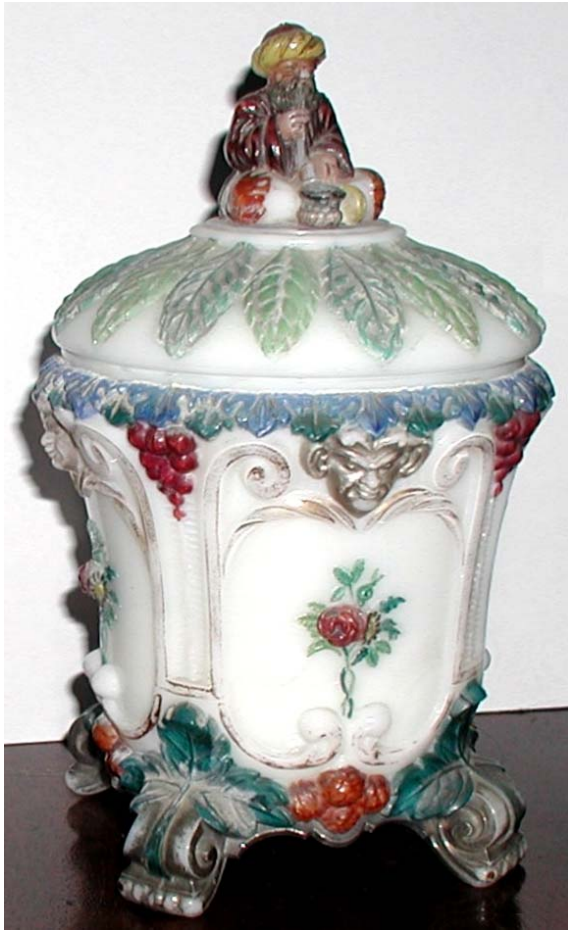
Abb. 2003-4/128 Tabak-Deckeldose mit Blättern u. Blüten, Araber mit Turban opak-weißes Pressglas, kalt bemalt, H 21 cm, D 13 cm Sammlung Fehr Portieux, um 1900 bis 1933 s. MB Portieux 1894, Planche 203, Article divers, Nr. 3834