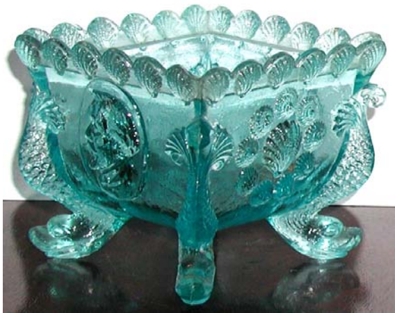
Abb. 2003-4/129 Deckeldose mit Muscheln und Delphinen (Deckel fehlt) Medaillon mit einem Mann mit Schlips (Louis Pasteur?, Politiker?) hellblaues Pressglas, H 10 cm, D 11 cm Sammlung Fehr Hersteller unbekannt, Frankreich, um 1900