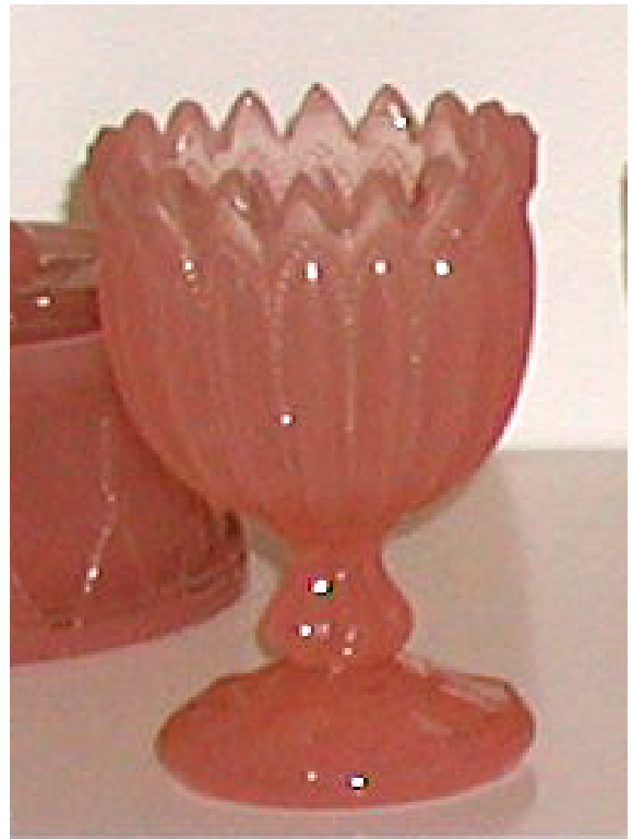
Abb. 2003-4/148 Fußschalen mit Rippen-Dekor rosa durchscheinendes Pressglas, H 14 cm, D 9,5 cm (größere Version s. Abb. 2003-4/146) Sammlung Fehr Hersteller unbekannt, Frankreich, um 1900