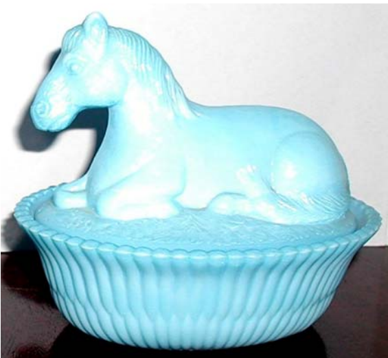
Abb. 2003-4/100 Deckeldose als Pferd auf einem Korb opak-weißes (u. opak-hellblaues) Pressgl., H xxx cm, L xxx cm Sammlung Fehr Jahresgabe NMGCS 1989, Summit Art Glass Co., USA s. Chiarenza 1998, S. 12 f., S. 181: Basis ursprüngl. McKee ähnlich MB Streit 1913, Tafel 15, Nr. 1754, L 14 cm, hell- weiß u. türkisblau (Fehr: Reproduktion nach McKee)