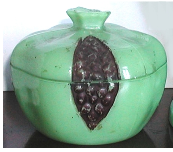
Abb. 2003-4/085 Deckeldose als aufgesprungener Granatapfel opak-grünes Pressglas, kalt bemalt, H 8,5 cm, D 10,5 cm Sammlung Fehr Vallérysthal / Portieux, um 1900 s. MB Vallérysthal 1913, Tafel 8, Diverse Artikel, kalt bemalt oder bronzirt, Zuckerdose „Granatapfel“