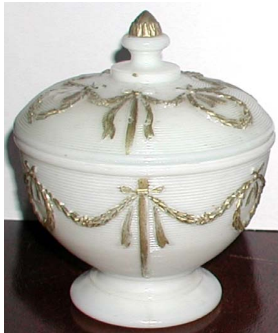
Abb. 2003-4/135 Deckeldose mit Girlanden opak-weißes Pressglas, kalt vergoldet, H 13 cm, D 11 cm Sammlung Fehr Meisenthal, um 1930 s. MB Meisenthal 1927, Pl. 81, Sucrier „Empire“