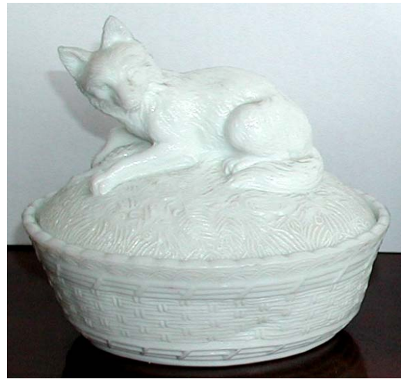
Abb. 2003-4/093 Deckeldose als Fuchs auf einem Korb opak-weißes Pressglas, H 11,5 cm, D 13 cm Sammlung Fehr Hersteller unbekannt, Frankreich, Deutschland, USA, um 1900