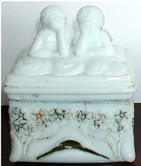
Abb. 2003-4/133 Deckeldose mit zwei Putten auf einer Wolke, Rosen opak-weißes Pressglas, kalt bemalt, H 13 cm, L 10,5 cm, B 8 cm Sammlung Fehr unten eingepresst „Gesetzlich geschützt D.R. 6.233“ Hersteller unbekannt, Deutschland, um 1900