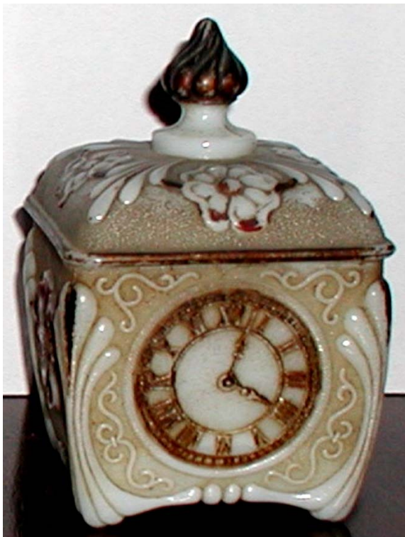
Abb. 2003-4/113 Deckeldose mit Uhren und Blüten opak-weißes Pressglas, kalt bemalt, H 14 cm, D 8,5 cm Sammlung Fehr Vallérysthal / Portieux, um 1900 unten eingepresst „VALLERYSTHAL“