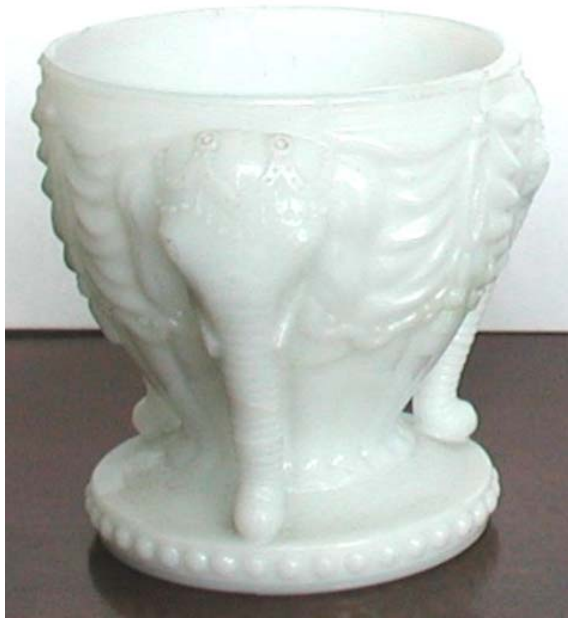
Abb. 2001-1/148 Deckeldose mit 3 geschmückten Elefanten und Mahout opak-weißes Glas, kalt bemalt, H xxx cm, D xxx cm Sammlung Roese HR 411 Hersteller unbekannt, um 1900