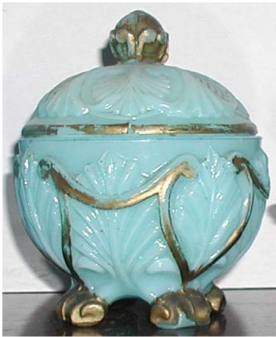
Abb. 2003-4/125 Deckeldose mit großen Blättern opak-hellblaues Pressg., kalt vergoldet, H 12 cm, D 10 cm Sammlung Fehr Vallérysthal / Portieux, um 1900 s. MB Vallérysthal 1908, Pl. 303, Nr. 3757