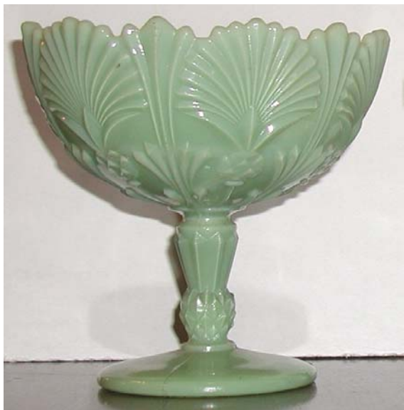
Abb. 2003-4/117 Fußschale mit Distel-Dekor opak-grünes Pressglas, H 12,5 cm, D 12,5 cm Sammlung Fehr Vallérysthal / Portieux, um 1900 s. Abb. 1998-1/004b Sammlung Geiselberger PG-306 opak-hellblaues Pressglas, leicht opalisierend H 9,4 cm, D 10,7 cm, in der Mitte der Schale ring- förmige Marke „VALLERYSTHAL“