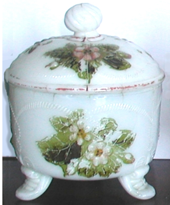
Abb. 2003-4/122 Deckeldose mit Blüten und Blättern opak-weißes Pressglas, kalt bemalt, H 13 cm, D 10,5 cm Sammlung Fehr innen unten eingepresst „SV“ Hersteller unbekannt, Frankreich, um 1900