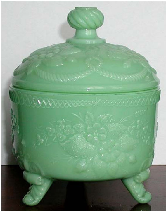
Abb. 2003-4/124 Deckeldose mit Blüten und Blättern opak-grünes Pressglas, H 13 cm, D 10,5 cm Sammlung Fehr außen unten eingepresst „SV“ Hersteller unbekannt, Frankreich, um 1900