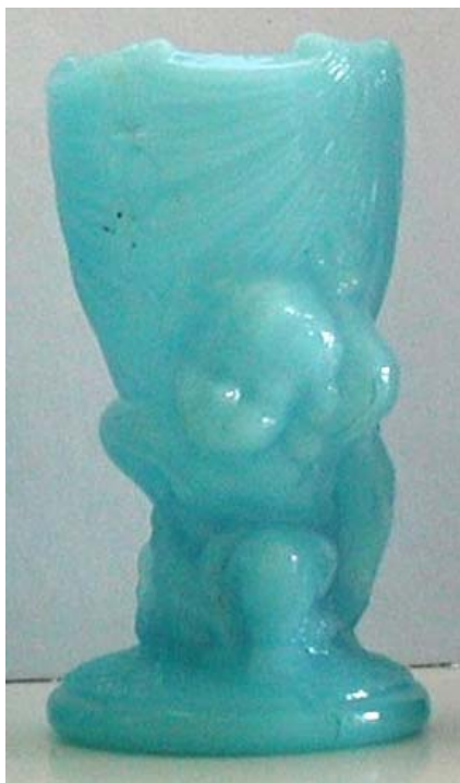
Abb. 2003-4/141 Eierbecher als Junge mit einer Muschel opak- hellblaues Pressglas, H 8 cm, D 4 cm Sammlung Fehr Vallérysthal / Portieux, um 1900 s. MB Vallérysthal 1908, Pl. 312, Nr. 4003