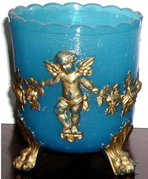
Abb. 2003-4/134 Deckeldose mit Putten und Girlanden opak-blaues, opalisierendes Pressglas, kalt vergoldet H 12,5 cm, D 11 cm Sammlung Fehr Hersteller unbekannt, Frankreich, um 1900