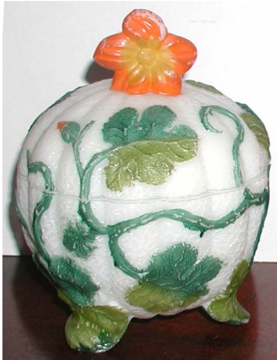
Abb. 2003-4/080 Deckeldose als Melone (Kürbis) mit Trompetenblüte, Blättern und Ranken opak-weißes Pressglas, kalt bemalt, H 14 cm, D 10,2 cm Sammlung Fehr Hersteller unbekannt, Frankreich oder Belgien, um 1900 s. MB Val St. Lambert, 1897, Planche 41, Sucriers, Nr. 28 (Abb. 2000-1/023) unten eingepresst „SV“ s. Slg. Vogt, Abb. 2003-4/081 u. / 082, innen Marke „SV“