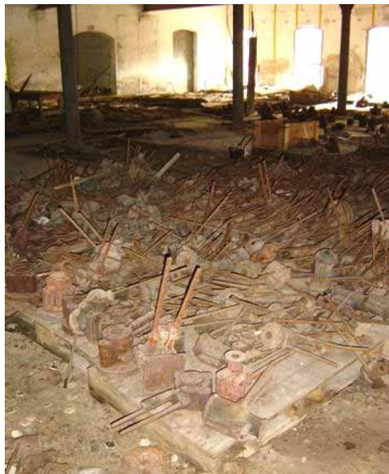
Abb. 2005-2/351 Ein Teil der Formen alter Pressglas-Modelle Lager im Glaswerk Portieux

werden können und welche überhaupt noch in den zwei Glaswerken vorhanden sind. Das ist eine sehr lange, schwere und komplizierte, aber auch interessante Arbeit. Wie Sie sicher bemerkt haben, findet man immer mehr gepresste Gegenstände von Vallérysthal & Portieux in klarem oder farbigem Glas auf den Flohmärkten und bei eBay.