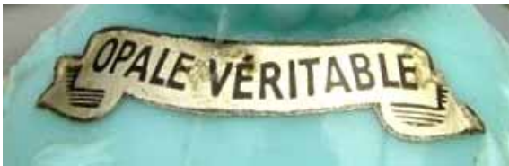
Abb. 2005-2/346 Etikett geschwungenes Band, Farben Hellgold / Schwarz „OPALE VÉRITABLE“ Eierbecher, opak-blaues Pressglas, Hersteller unbekannt, um 1970, wohl Portieux Sammlung Chiarenza