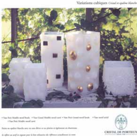
Abb. 2005-2/348 a Prospekt „Cristal de Portieux“, um 1980 „Variations cubiques Cristal et opaline blanche“

Vallérysthal & Portieux haben auch noch nach 1971 Opalin-Glas gepresst und verarbeitet, siehe „variations cubiques“ (siehe Foto; vielleicht um 1980). Dieses Opalin-Glas ist durchscheinend. Man kann noch heute diese Modelle im Laden des Glaswerks Vallérysthal kaufen.