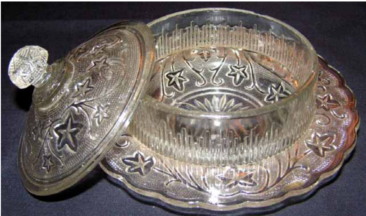
Abb. 2005-2/382 Butterdose mit Efeublättern und -ranken, farbloses Pressglas, H 11 cm, D 17 cm, Sammlung Rühl-Sadler AG für Glasfabrikation, vormals Gebrüder Hoffmann, Bernsdorf O.-L., 1932 (Ankerglas) vgl. MB Bernsdorf 1932, Tafel 32, Nr. 669/670, Butterdose „Efeu“, D 17 bzw. 12 cm