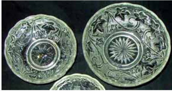
Abb. 2005-2/383 Schale groß mit Efeublättern und -ranken (rechts) farbloses Pressglas, H 5 cm, D 13,5 cm Sammlung Rühl-Sadler AG für Glasfabrikation, vormals Gebrüder Hoffmann, Bernsdorf O.-L., 1932 (Ankerglas) vgl. MB Bernsdorf 1932, Tafel 32, Nr. 669/670, Butterdose „Efeu“, D 17 bzw. 12 cm