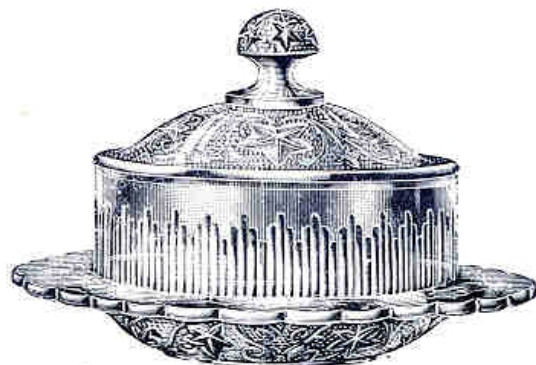
Abb. 2001-05/439 (Ausschnitt) MB Bernsdorf 1932, Tafel 32, Butterglocken, Butterdosen Sammlung Schmidt