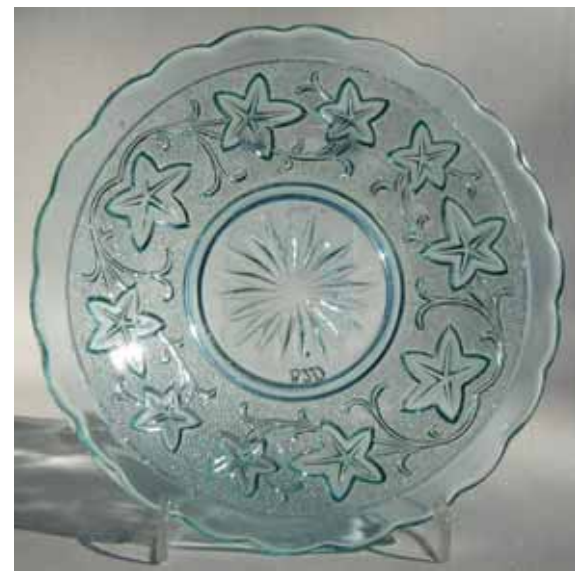
Abb. 2004-4/245 Teller mit Efeublättern und -ranken, Sablée blau-blau Glas, D 15 cm, Rand ohne Perlenbögen Sammlung Geiselberger PG-820 [Hersteller unbekannt, Frankreich?, um 1900?] AG für Glasfabrikation, vormals Gebrüder Hoffmann, Bernsdorf O.-L., 1932 (Ankerglas), vgl. MB Bernsdorf 1932, Tafel 32, Nr. 669/670, Butterdose „Efeu“ , Das Dekor des Tellers ist dem des Tellers mit Lilienblüten sehr ähnlich. s.a. Schale mit Efeublättern, Slg. Geiselberger PG-739 s.a. blaue Fußschale Sammlung Maierholzner