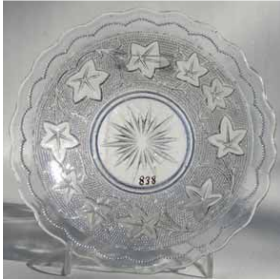
Abb. 2004-4/248 Schale mit Efeublättern und -ranken, Sablée farbloses Glas, H 7,6 cm, D 23,5 cm, Rand m. Perlenbögen Sammlung Geiselberger PG-739 s.a. Sammlung Lenek, D ca. 18 cm [Hersteller unbekannt, Frankreich?, um 1900?]

AG für Glasfabrikation, vormals Gebrüder Hoffmann, Bernsdorf O.-L., 1932 (Ankerglas), vgl. MB Bernsdorf 1932, Tafel 32, Nr. 669/670, Butterdose „Efeu“