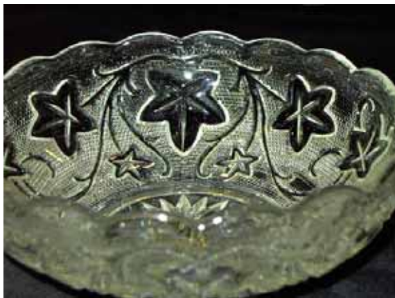
Abb. 2005-2/384 Schale klein mit Efeublättern und -ranken farbloses Pressglas, H ca. 3,5 cm, D 10 cm Sammlung Rühl-Sadler AG für Glasfabrikation, vormals Gebrüder Hoffmann, Bernsdorf O.-L., 1932 (Ankerglas) vgl. MB Bernsdorf 1932, Tafel 32, Nr. 669/670, Butterdose „Efeu“, D 17 bzw. 12 cm