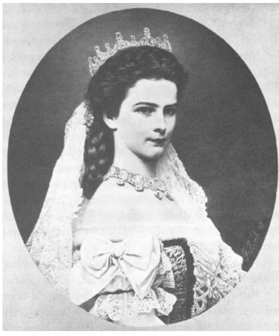
Abb. 2003-3/010 Portrait Kaiserin Elisabeth 1867 Fotografie aus Kühnel 1984, S. 34