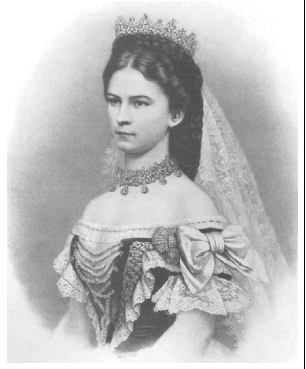
Abb. 2003-3/013 Portrait Kaiserin Elisabeth 1867 Lithografie von Piloty u. Loechle aus Waissenberger 1981, S. 195 f., Kat.Nr. 346