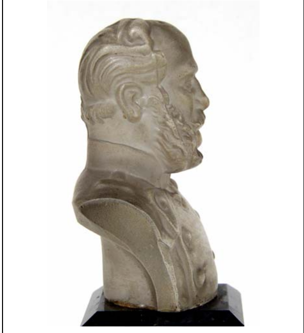
Abb. 2000-5/120 (Ausschnitt) Statuette m. Bildnis Kaiser Franz Joseph I. von Österreich aus Adlerová 1995, S. 7 farbloses Glas, H 20,3 cm, Sockel aus schwarzem Glas Harrach'sche Glashütte, Nový Svět, 1855 Sammlung Kunstgewerbemuseum Praha

Abb. 2003-3/001 Portraitbüste Kaiser Franz Joseph I. von Österreich-Ungarn farbloses Pressglas, mattiert, Büste H 6,6 cm, quaderförmiger Sockel aus schwarzem, geschliffenem und poliertem Glas, H 6,6 cm Sammlung Geiselberger PG-705 (ehem. Sammlung Wenske, Halberstadt) wohl Josef Riedel, Polubný [Polaun], um 1880 s. Riedel 1994, S. 132 f., Abb. 247, Abb. 248, Abb. 249, Abb. 251 u. Riedel 1991, S. 88 f.