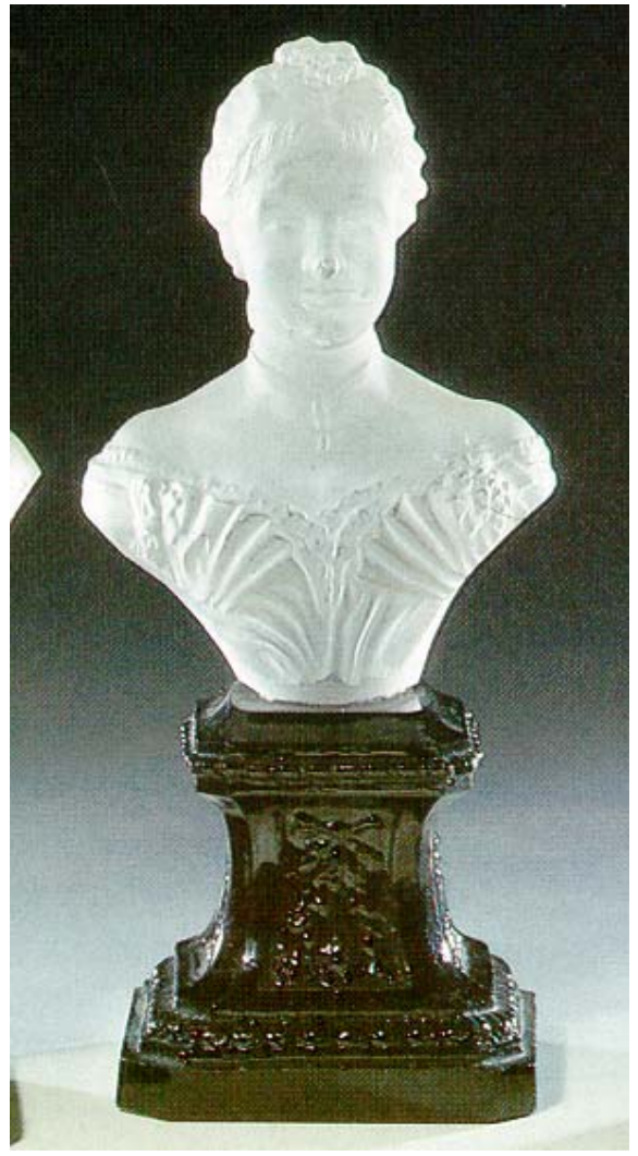
Abb. 1999-5/053 Büste Kronprinzessin Stephanie von Belgien aus Riedel 1994, S. 132, Abb. 248 farbloses und schwarzes Glas, gepresst, mattiert Sockel mit Reliefdekor, H 14 cm „Riedel, um 1880, Glasmuseum Jablonec [Gablonz]“