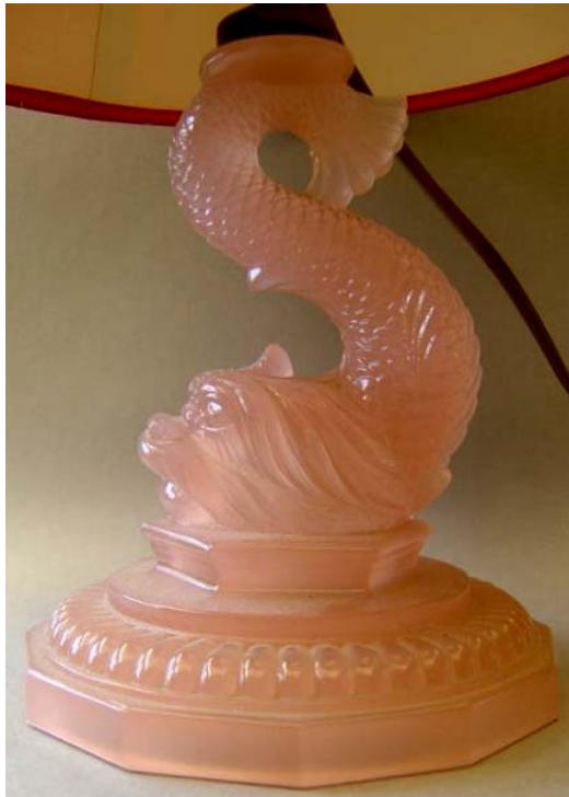
Abb. 2005-3/127 Delphin als Fuß einer Lampe (oder Schale ...) opak-hellblaues Pressglas, H 14,9 cm, D 12,4 cm Sammlung Christoph, eingesteigert in den USA ohne Marke, Hersteller unbekannt SG: der Delphin ist den Fischen aus Portieux sehr ähnlich nach Auskunft von Marc Christoph werden in Vallérysthal und Portieux keine opak-fabrigen Gläser mehr hergestellt und verkauft, das bedeutet, dass dieser Delphin älter ist, oder dass er doch aus einem anderen Glaswerk kommt, vielleicht sogar eine Kopie aus den USA