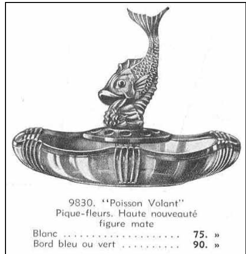
Abb. 2002-4/394 Blumensteckschale mit Delphin [„Dolphin Bowl“] Pressglas, Figur H 22 cm, Schale D 28,5 cm Pottery Gazette & Glass Trade Review, February 1962 Bohemia Glass, CSSR 1952-1962 s. MB Markhbeinn 1935, Tafel 42, Nr. 9830 MB Markhbeinn 1937, Tafel 81, Nr. 9830 wahrscheinlich Inwald, Tschechoslowakei, ab 1935 - 1939 Sklo Union, Rudolfova hut', 1948 / 1952 - 1962 ... (?) Bohemia Glass war die Handelsmarke von Glassexport für alle exportierenden Glaswerke, darunter auch einige frühere Glaswerke Inwald