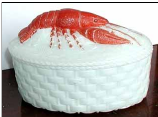
Abb. 2003-4/094 Deckeldose als Krebs auf einem Korb opak-weißes Pressglas, kalt bemalt, H 9 cm, L 13,5 cm Sammlung Fehr (s.a. Sammlung Stopfer, farbloses Pressglas) s. MB Kastrup Glasværk, um 1900, Plan D5, Nr. 824 s. MB Pressglas Hersteller unbekannt 1930, Tafel 11, Butterdosen, Zuckerdosen, Zuckervaseln, Nr. 465

Die Dose der Sammlung Fehr stammt eher von dem unbekanntem mährisch-slowakischen Glaswerk als aus dem dänischen Glaswerk Kastrup. Sie könnte aber schon aus den Jahren um 1900 stammen!