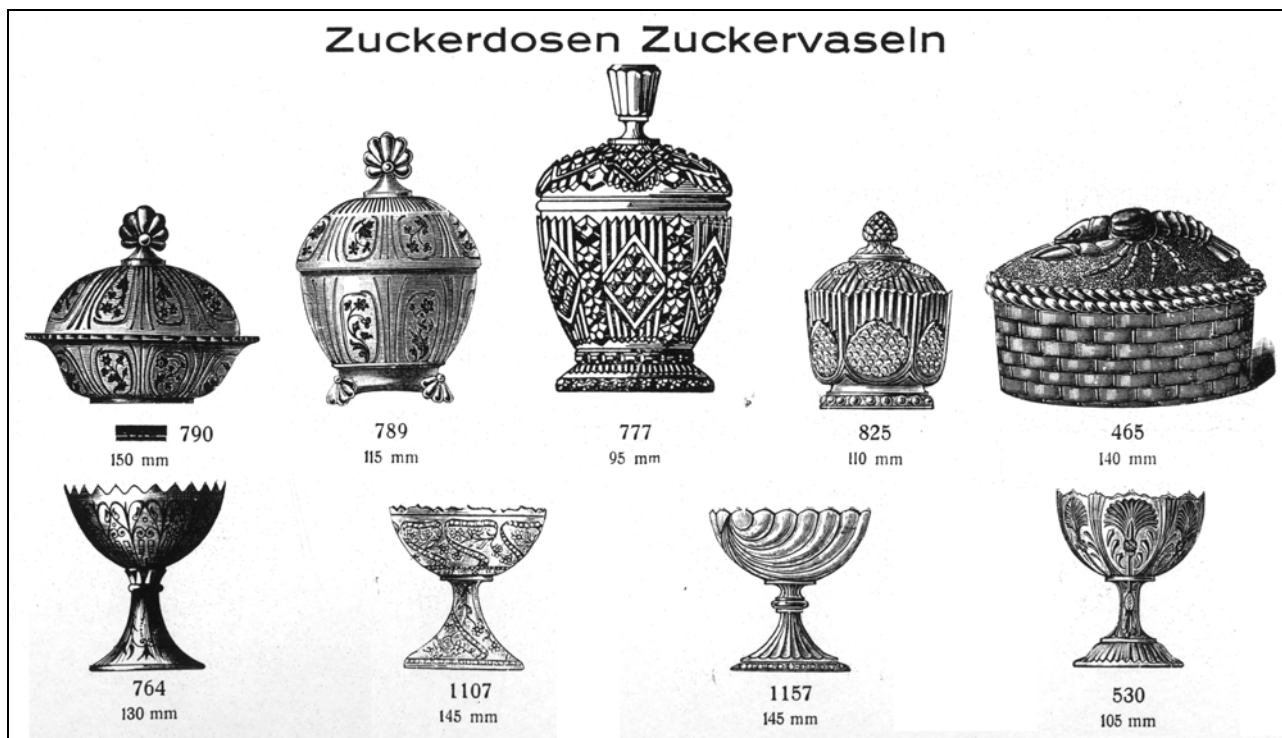
Abb. 2007-1-10/001 (Ausschnitt) MB Pressglas Hersteller unbekannt 1930, Tafel 11, Zuckerdosen, Zuckervaseln