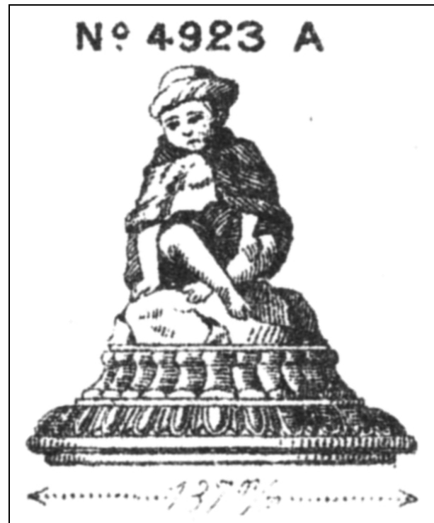
Abb. 2001-04/355 (Ausschnitt) MB Baccarat 1893, Tafel 58, Presse-papiers (Sujets dépolis) No. 4923 A, Mahout der Elefanten auf Dose No. 4945 D 13,7 cm Reprint Edition Collections Livres Brüssel 2000

Abb. 2008-1/151 rechts eBay FR, Art.Nr. 330191882611, €260,00 "Sucrier ou bonbonniere orientaliste en opaline de foire, fin 19 ème à début 20 ème, pas de signature , très certainement une fabrication de Vallèrysthal ou Portieux " H 15 cm, D 9 cm SG: Hersteller unbekannt, Frankreich?, um 1900? nicht Baccarat um 1870, Reich & Co., um 1880 vgl. MB Baccarat, um 1880?, Planche 273, No. 4945 vgl. MB Reich 1880, Tafel B, Nr. 1727 PK 2005-1, S. 62 ff., Abb. 2005-1/105 u. Abb. 2003-2-04/004 nicht in MB Vallèrysthal oder Portieux