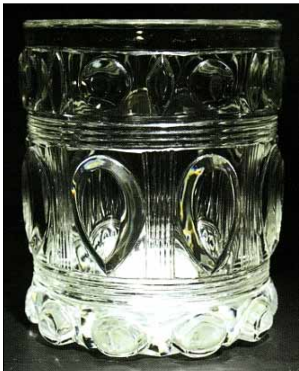
Abb. 2008-3/100 gobelet séditieux en crystal taillé de pastilles, navettes et cabochons séparés par des filets verticaux et horizon-taux, le fond [Boden] est orné en inclusion d'un cristallo-cérame représentant le profil gauche de Napoléon 1 er en empereur romain : revers taillé à pointes de diamants, H 10 cm Bercy, Epoque Restauration [1815-1848] SG: dieser Becher ist in MB Launay, Hautin & Cie., um 1840, nicht zu finden, Bercy wurde nicht von LH vertreten! Auktionskatalog Boisgirard April 2005, S. 3, No. 5

Im Auktionskatalog April 2005 mit Paperweights sind einige besonders interessante Stücke dabei: Zar Alexander I. von Russland, farbige Paste; Kaiser Napoléon I. in mehreren Varianten - der Kaiser konnte sich auch in der Restauration immerhin als Presse-papier und Becher halten; - ein Becher mit einer Paste Napoléon I. im Boden ; ein Anhänger mit Joseph Haydn von Montcenis - bisher noch nie gesehen!