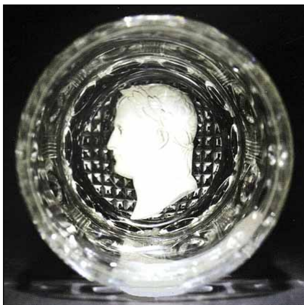
Abb. 2008-3/101 Presse-papiers à fond rouge translucide orné d'un cristallo-cérame représentant le profil droit de Napoléon 1 er en empereur romain , couronne périphérique de bonbons verts et blancs alternés avec des bonbons blancs étoilés. Etoile taillée au revers. D 8 cm, H 5,4 cm Baccarat, um 1850 Aufruf € 800 / 1.000, Gebot € 900 Auktionskatalog Boisgirard April 2005, S. 3, No. 6