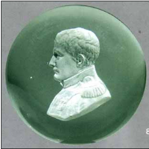
Abb. 2008-3/104 Presse-papiers à fond bleu ciel orné d'un crystallo-cérame représentant le buste de Louis-Philippe [reg. 1830-1848] D 8,2 cm, H 4,2 cm Clichy [1830-1848?] Aufruf € 400 / 500, Gebot € 450 Auktionskatalog Boisgirard April 2005, S. 3, No. 9

Abb. 2008-3/103 Presse-papiers orné d'un crystallo-cérame représentant le buste de Napoléon 1 er D 6,6 cm, H 4,1 cm [Hersteller unbekannt, um 1820] Aufruf € 300 / 400, Gebot € 1.000 Auktionskatalog Boisgirard April 2005, S. 3, No. 8