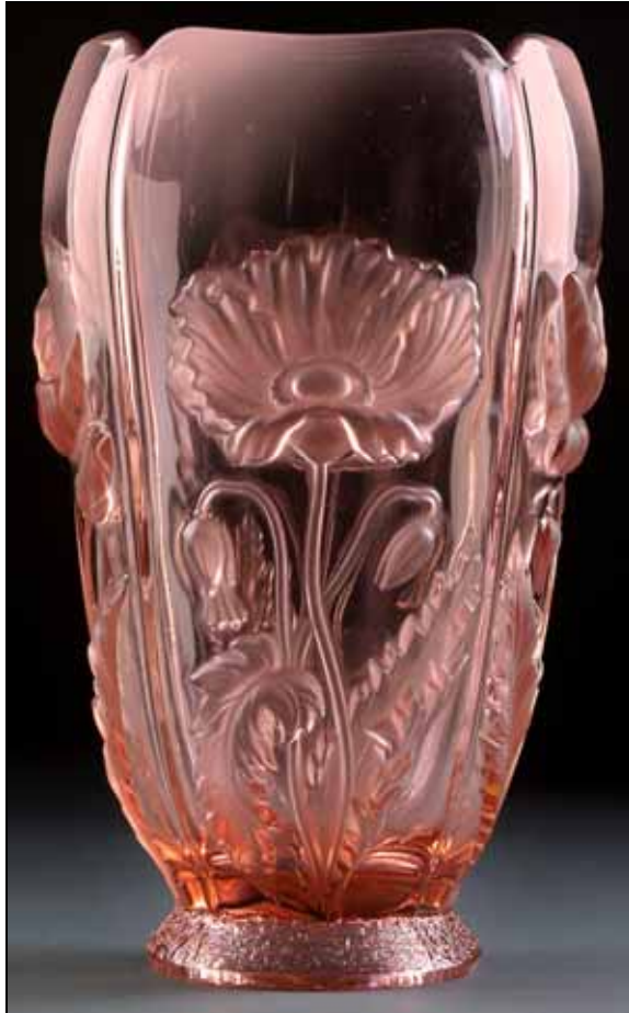
Abb. 2006-1/317 Vase mit Mohnblumen rosa-farbenes, teilw. satiniertes Pressglas, H 23,8 cm, D 13 cm Sammlung Weihs ohne Marke MB Glassexport „Barolac“ um 1949/1952, Tafel B2, Nr. 11360

Als Entwerferin wird Věra Potůčková angegeben. Über Potůčková ist bisher nichts bekannt. Bei der Suche nach ihr in Newhall „ Catalogue Search “ findet man Heřmanova Huť 1981, Prod.Nr. 20321 , Plate und Bowl, Potůčková, ohne Abbildung. Im Vergleich mit allen bei Heřmanova Huť aufgeführten Pressgläsern fallen die „Mohnblumen“-Gläser völlig aus dem Rahmen. Sie sind auch in den 3 Katalogen nicht zu finden - auch nicht die Prod.Nr. 20321. In Newhall 2008, S. 36, wird Potůčková als freie Entwerferin in den 1960-er Jahren für Sklo Union angegeben, ohne Angaben auf S. 126.