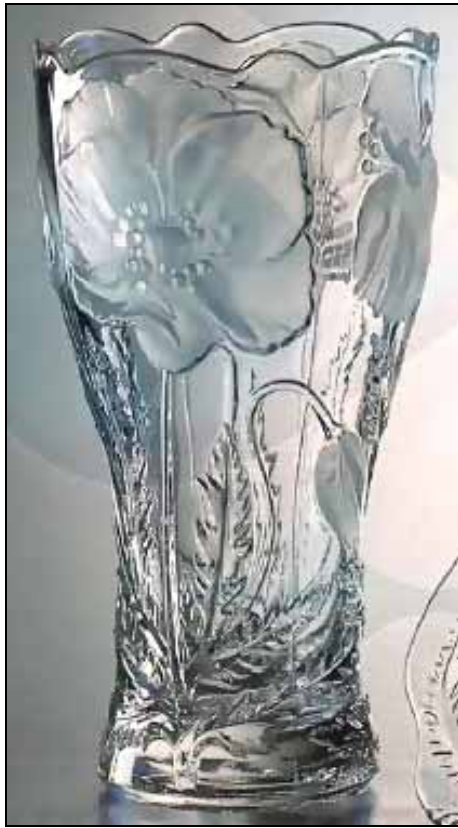
Abb. 2009-1/350 Vase mit Mohnblüten, Garnitur „Feldmohn“ farbloses, teilw. mattiertes Pressglas, H 24 cm, D ??? cm s. MB Rudolfova huť / Obalunion 1991, Tafel 18, Nr. 13548 A s. MB Rudolfova huť / Avirunion 1993, Tafel 13, Nr. 13548 A aus Newhall, Sklo Union - Art Before Industry: 20th Century Czech Pressed Glass, England 2008, CD Kataloge