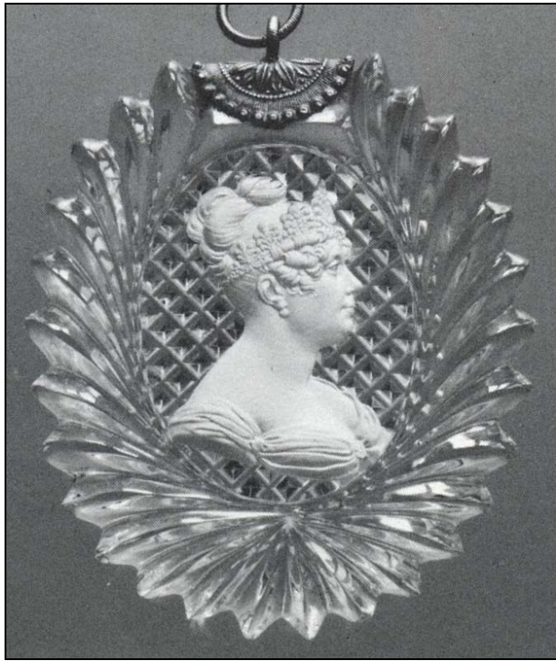
Abb. 2009-4/039 Goldmedaille Desirée Bernadotte-Clary, um 1818? DESIDERIA SVERIGES OCH NORRIGES DROTNING bis 1796 Verlobte Napoleon Bonapartes, 1798 Hochzeit mit General Jean-Baptiste Bernadotte, 1818 als Karl XIV. König Johann von Schweden sign. Barre, verwendet als Belohnungsmedaille 1853 http://www.muenzauktion.com/wallinmynt/item.php?id=1664