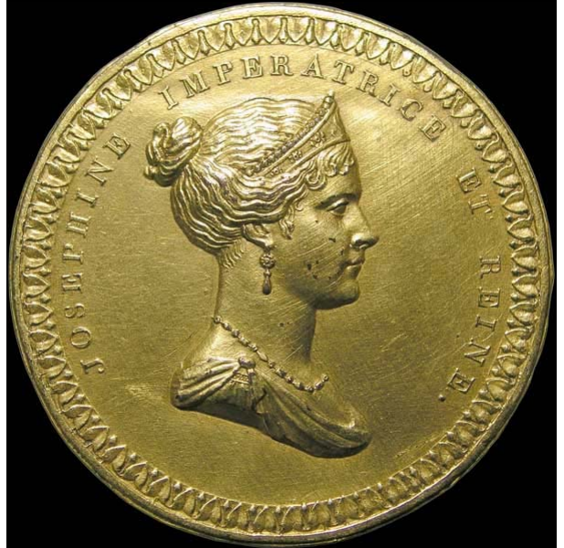
Abb. 2009-4/021 Medaille JOSEPHINE IMP. ET REINE (nach ihrem Tod 1814) A L'IMMORTELLE IMPÉRATRICE DES FRANÇAIS Inside the wreath, JOËSPHINE TASCHER DE LA PAGERIE NÉE À LA MARTINIQUE EN 1765 MARIÉE AU GÉNÉRAL BONAPARTE EN 1796 DIVORCÉE EN 1809 MORTE A LA MALMAISON EN 1814 sign. ???; Essling 2976 http://www.napoleonicmedals.org/coins/pe-2976.htm