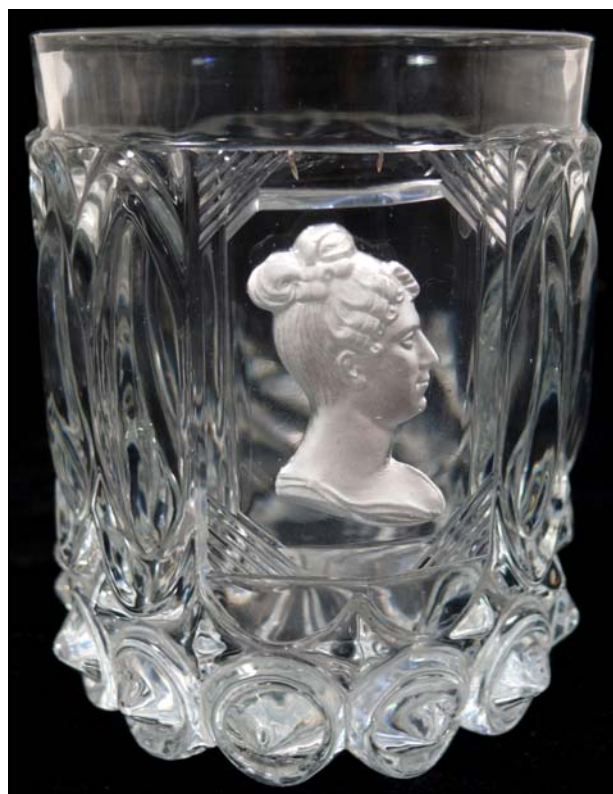
Abb. 2009-4/002 Becher Cristallerie de Baccarat, um 1830 Königin Marie-Amélie de Bourbon von Frankreich vgl. Darnis 2006, S. 154, No. 107, nach Gatteaux 1830 Sammlung Flößer- und Heimatmuseum im Schloss Wolfach

Der Stil hatte sich von der Kaiserzeit - dem klassizistischen „ Empire “ - über die „ Restauration “ 1815-1830 mit einem rückwärts gewandten Stil zum Stil unter Bürgerkönig Louis Philippe verändert, nach P. W. Hartmann „Fortsetzung des schweren und überreichen bürgerlichen Stils der Restauration“. Typisch für die Restauration sind die Pasten von Duchesse de Berry und Duchesse d'Angoulême zwischen 1815-1830.