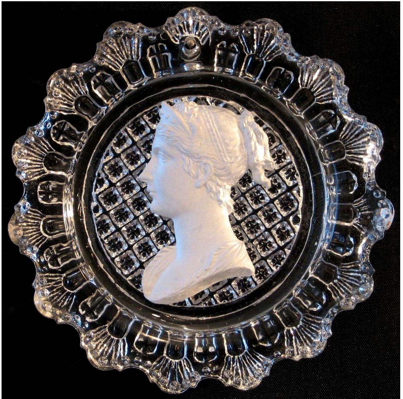
Abb. 2009-4/013 ( Maßstab ca. 195 %! ) Plakette mit eingeglastem Pastenbild Kaiserin Joséphine de Beauharnais / Bonaparte mit Pseudo-Diamanten und Blüten? Vorbild einer Medaille noch nicht gefunden, Paste ohne Signatur, farbloses, gepresstes Kristallglas, H 2 cm, D 8,5 cm Sammlung Vogt, PV-693 PK 2009-4, SG: Frankreich, 1830-1848 vgl. Plakette mit eingeglastem Pastenbild Kaiser Napoléon I., Sammlung Vogt PV-601, PK Abb. 2009-3/003