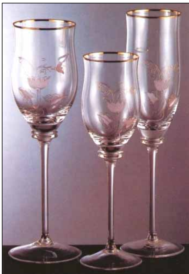
Abb. 2010-1/324 Trinkservice MS 42757 / D 43517, J. Matoušková aus New Glass Review 1993-12, S. 4