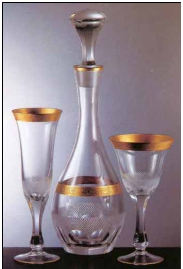
Abb. 2010-1/322 Trinkservice MS 42760 / D 42549 „ Buckingham “, J. Matoušková aus New Glass Review 1993-12, S. 5

Andere bemühen sich dann, für die traditionellen Techniken ein moderneres „Antlitz“ zu finden. Eine Kostprobe für Liebhaber konservativerer Auffassung repräsentieren auch Kelchglasgarnituren, die am Mündungsrand eine Verzierung mit Panthographen mit goldenem Band kombinieren und die im unteren Teil des Kelchs um einen zarten matten Nachschliff (z.B. Dekor „ Buckingham “) ergänzt werden.