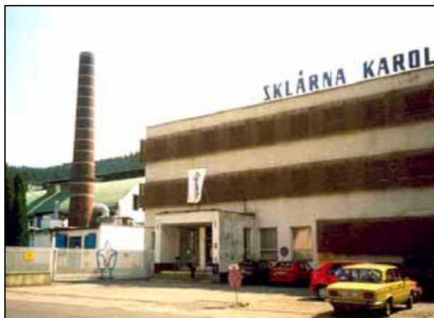
Abb. 2002-4/182 und Abb. 2002-4/183 Glaswerk Karolinka, Eingang und Bürogebäude, August 2002 Werkstätte und Lagerplatz für Holzformen, in beiden Regalen liegen Hunderte von Holzformen

Als ich im August 2002 an dieser Glasfabrik im äußersten Nordosten Mährens - nahe der Grenzen und Passübergänge zu Polen und Slowakei - zum ersten Mal vorbei fuhr, machte ich zwei Fotos, auf denen nur noch wenig Aktivität zu erkennen war. Es sah nicht nach Produktion aus, der Kamin rauchte nicht . Die auf dem Hof lagernden Holzformen wurden offenbar von niemand mehr benutzt. Aber es lagen noch Stämme für neue Holzformen auf dem Hof.