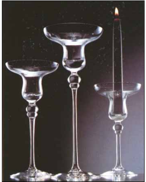
Abb. 2010-1/330 Trinkservice MS 42747 / D 435133, J. Matoušková aus New Glass Review 1993-12, S. 7