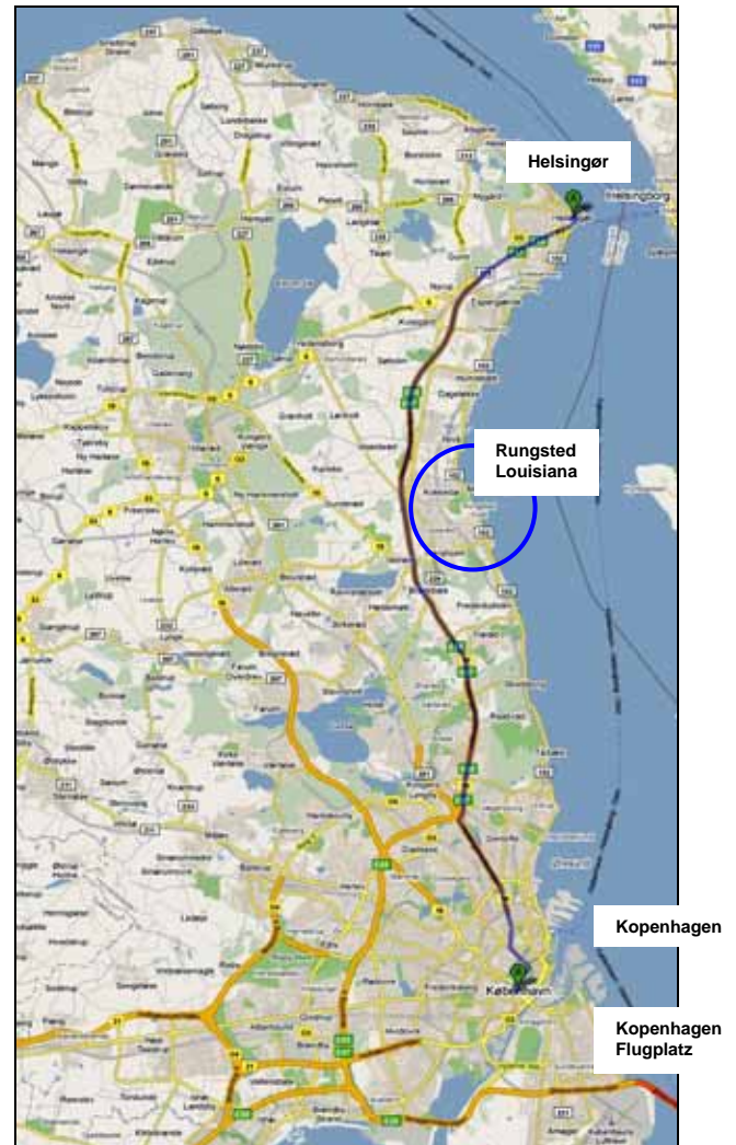
Abb. 2009-3/455 Fahrt Helsingør - Rungsted / Louisiana - Kopenhagen Ausschnitt aus GOOGLE Maps 2010-03

http://www.kopenhagen.se ... Hotels http://www.hot-map.com/de/kopenhagen ... Stadtplan http://www.rosenborgslot.dk/ http://de.wikipedia.org/wiki/Schloss_Rosenborg http://kunstindustrimuseet.dk/en http://www.tivoli.dk/