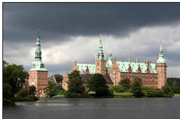
Abb. 2009-3/456 Hillerød - Schloss Frederiksborg

Außerdem finden Sie hier die wichtigsten Websites . Bei der Ausgabe der PK 2010-1 als PDF können Sie die Adressen in den Bildüberschriften direkt anklicken! Das gilt auch für alle im Text angegebenen Web-Adressen.