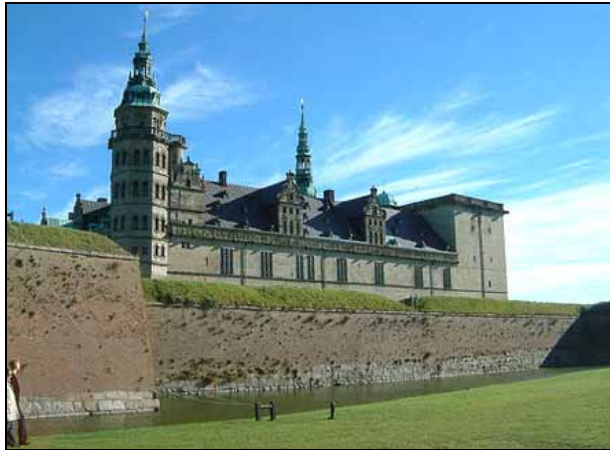
Abb. 2009-3/457 Helsingør, Schloss Kronborg

über die Glassammlung in Anneberg ) kleines Mittagessen 0,5 Std. vielleicht Führung durch die Sammlungen Hempel und Heering mit Bendt Svoldrup 13.00 Uhr Vig Trödlersmarkt ca. 1,5 Std. Von Vig nach Holbæk - Frederikssund - Slangerup - Hillerød / Schloss Frederiksborg - Fredensborg (Pause für Spaziergang) - Helsingør (Abendessen)