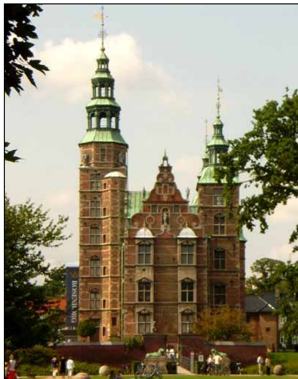
Abb. 2009-3/454 Kopenhagen, Schloss Rosenborg Sammlung wertvoller Gläser seit der Renaissance Kronjuwelen etc., Website http://www.rosenborgslot.dk

SG: Beim Treffen der Leser und Freunde der Pressglas-Korrespondenz in Frauenau Ende Juni 2008 wurden für kommende Ausflüge drei interessante Ziele vorgeschlagen: die Glassammlungen in Coburg, Lauscha