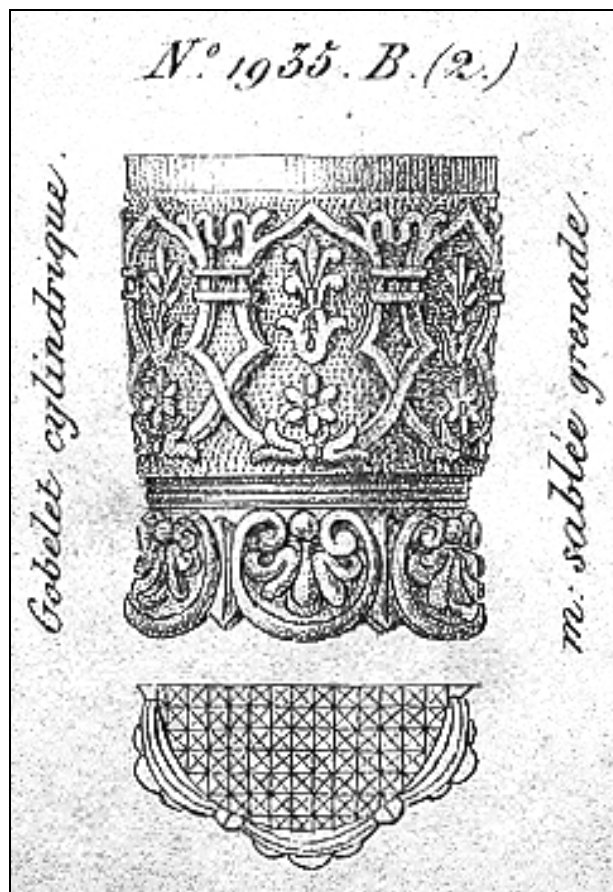
Abb. 2012-1/09-02 → Becher mit eingeglaster Paste „Friedrich von Schiller“ Vorbild Medaille Barre, Paris 1819 mit Ranken und Palmetten, Sablée farbloses Kristallpressglas, H 10 cm, D 8 cm Sammlung Jakob vgl. MB Launay, Hautin & Cie. um 1840, Planche 56, No. 1935 Baccarat, um 1840, „Gobelet cylindrique m sablée grenade“ vgl. PK Abb. 2001-1/139, Pastenglas mit „Johann Wolfgang von Goethe“, Hersteller unbekannt, wohl Neuwelt, um 1850 PK 2012-1, SG: Baccarat, bis 1840