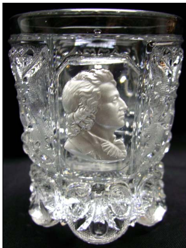
SG: Die Zuschreibung der Becher mit Pasten von Schiller und Goethe ist noch immer nicht sicher aufgeklärt. Die Zuschreibung „Herst. unbekannt, wohl Neuwelt, um 1850“ wurde bei PK 2001-1 auf dem Stand des Wissens noch mit Einschränkung übernommen vom