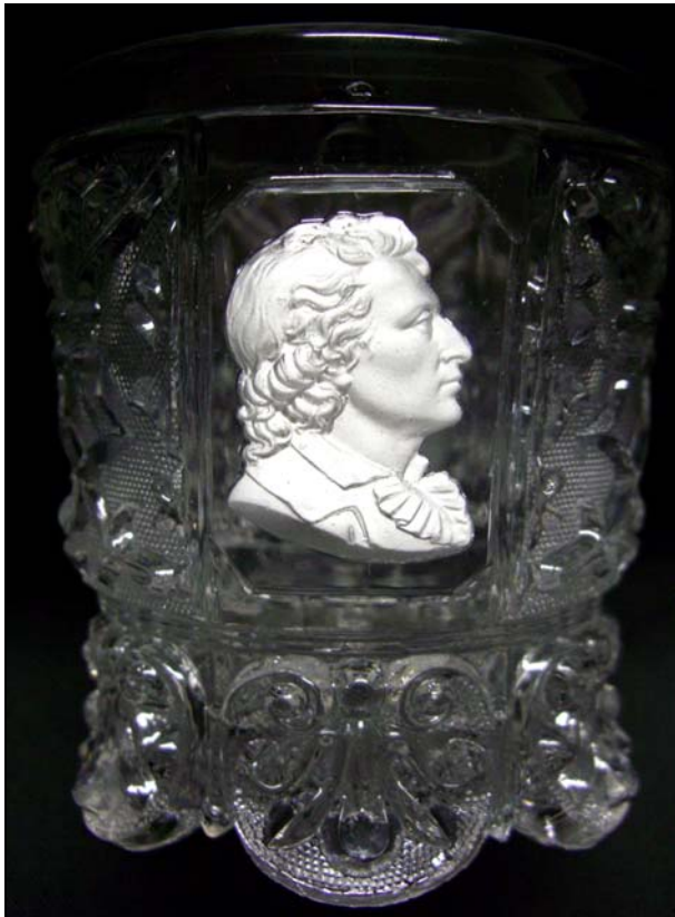
Abb. 2012-1/09-04 Becher mit eingelaster Paste „Friedrich von Schiller“ Vorbild Medaille Barre, Paris 1819 mit Ranken und Palmetten, Sablée farbloses Kristallpressglas, H 10 cm, D 8 cm Sammlung Jakob vgl. MB Launay, Hautin & Cie. um 1840, Planche 56, No. 1935 Baccarat, um 1840, „Gobelet cylindrique m sablée grenade“ vgl. PK Abb. 2001-1/139, Pastenglas mit „Johann Wolfgang von Goethe“, Hersteller unbekannt, wohl Neuwelt, um 1850 PK 2012-1, SG: Baccarat, bis 1840