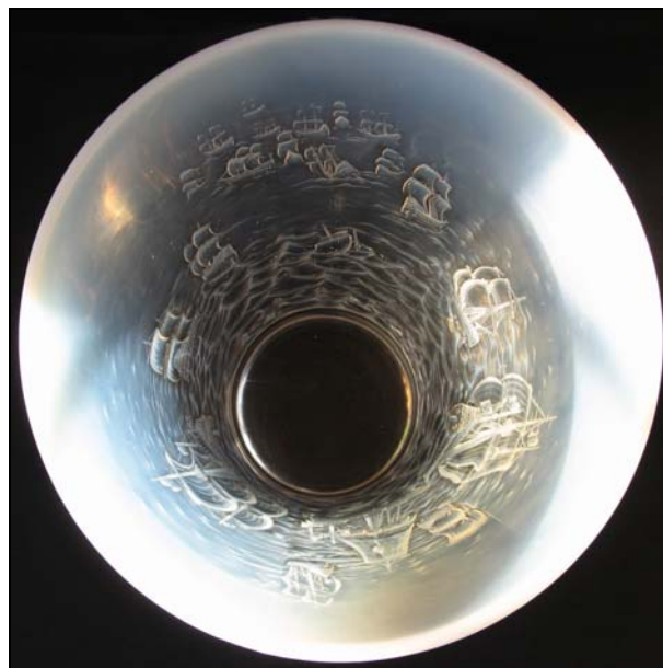
Abb. 2003-4-12/001, MB Inwald 1934, Tafel 157, Vasen, Sammlung Muzeum skla a bižouterie Jablonec nad Nisou

nicht in MB Inwald BAROLAC 1932-1934, nachweisbar durch eingepresste Marklen „Barolac“ und MB Glassexport „Barolac“ 1949/1952, Tafel B 4, Vase Nr. 11460