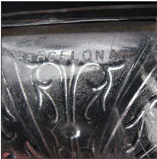
Abb. 2012-1/25-03 → Las Mentiras ... que son muchas vida ... Cristalerías Planell, Barcelona 1885-1953 http://mtvo-lasmentiras.blogspot.com/2011/11/cristalerias-planell-barcelona-1885.html