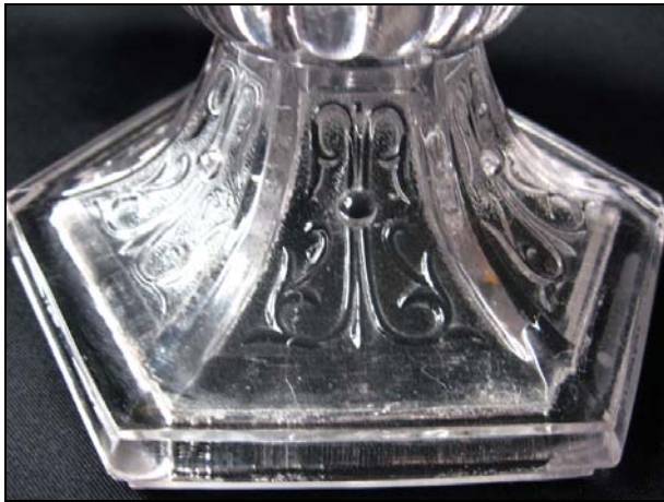
Abb. 2012-1/25-02 Leuchter mit gewundenen Walzen, Sablée leicht violette Pressglas, H 23 cm, D Fuß 11,5 cm Sammlung Michl im Fuß eingepresste Marke „LLIGÉ y C A BARCELONA“, Spanien, vor/um 1900?