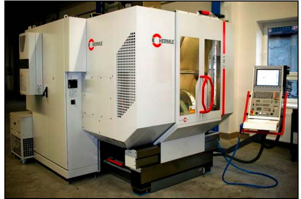
Abb. 2012-1/90-05 & Abb. 2012-1/90-06 Maschine Hermle C 30 U Maschine Berhringer www.nedform.cz/index.php?lang=cz&id=galerie

We manufacture mainly metal moulds for mechanical and manual production for glass industry both from standard materials like cast-iron and ductile cast iron and also from high-quality stainless steel as well (see chapter „Materials“).