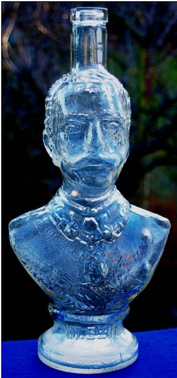
Abb. 2012-1/05-02 (Maßstab ca. 50 %) König von Italien Vittorio Emanuele III. und Königin Elena farblose, press-geblasene Flasche H 31 cm, B 15 cm, D 9 cm eingepresste Inschrift „VIT. E LE III“ Sammlung Stopfer Hersteller unbekannt, Italien, nach 1945

Krönung von König Vittorio Emanuele III. bis spätestens 1946. Die Familie Savoien wurde in Italien ab 1946 abgesetzt und des Landes verwiesen, die Rückkehr nach Italien wurde ab 1948 verboten und erst 2002 erlaubt. Sicher wurden diese Flaschen nach dem Zweiten Weltkrieg schon mehrere Jahre vor 2002 hergestellt. Der Hersteller ist unbekannt.