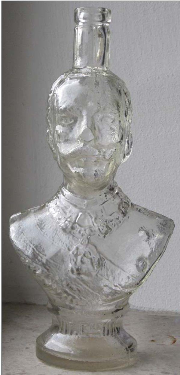
Abb. 2012-1/05-03 (Maßstab ca. 50 %) Rosoglio-Flasche König Vittorio Emanuele III. farblose, press-geblasene Flasche (Nasenspitze abgebrochen) H 31 cm, B 15 cm, D 9 cm eingepresste Inschrift „VIT. E LE III“ Sammlung SG, Kauf in München um 1975? Hersteller unbekannt, Italien, nach 1945