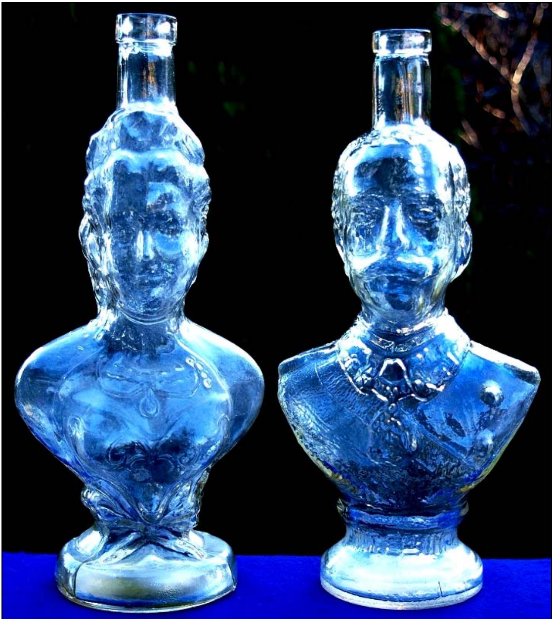
Abb. 2012-1/05-01 (Maßstab ca. 50 %) Rosoglio-Flaschen Königin Elena und König von Italien Vittorio Emanuele III., reg. 1900-1946 farblose, press-geblasene Flaschen, H 31 cm, B ??? / 15 cm, D 9 cm, eingepresste Inschrift „VIT. E LE III“ Sammlung Stopfer Hersteller unbekannt, Italien, nach 1945