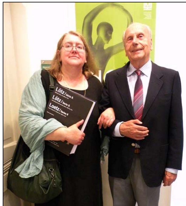
Abb. 2012-2/43-23 Ausstellung „INGRID - mehr als eine Marke - Víc než jen značka“, Muzeum skla a Bižuterie Jablonec nad Nisou, 11. Mai - 28. Okt. 2012