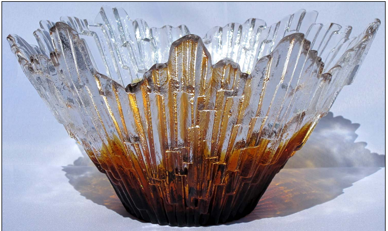
Abb. 2012-3/26-01 Tiefe Schale mit Strahlen-Muster, farbloses und bernstein-farbenes Pressglas, H max 13,5 cm, D max 23,5 cm Sammlung Boschet auf der Unterseite eingravierte Signatur „Tauno Wirkkala“, Eisglasvase „Revontulet“, Glaswerk Humppila, Finnland, um 1970