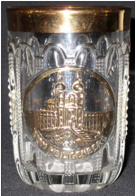
Abb. 2009-4/240 (Maßstab ca. 90 %) Becher mit Bild einer Wallfahrtskirche eingepresste Inschrift „VOM HEILIGENBERG“ [Svatý Kopeček, nördlich Olomuc [Olmütz], Nordmähren] 2 rückseitige, runde Medaillons leer Sammlung Maierholzner fbl. Pressglas, Gebäude u. Rand vergoldet, H 9,9 cm, D 6,9 cm vgl. Preis-Kurant Pressglas Inwald 1914, Nr. 6383, „Walzenbrillant“, s.a. PK Abb. 2002-4/107, Sammlg. Geiselberger PG-069

Wikipedia DE: Durch die westlich angrenzende Herrschaft Holešov (Holleschau) verlief einst die Bernsteinstraße . Um 200 v. Chr. soll sich auf dem Berg Hostýn ein keltisches Oppidum befunden haben. Westlich von den Bergen liegt die fruchtbare Ebene Haná (Hanna), die Einwohner hießen Hanáci (Hannaken) mit eigener Mundart und Volksbräuchen. Im 16. Jhd. hatte sich Holešov zu einem Zentrum der Böhmischen Brüder entwickelt, deren Synoden 1573 und 1577 hier stattfanden. Die jüdische Gemeinde war eine der Größten in Mähren und 1560 entstand nach dem Brand der alten eine neue Synagoge (bis heute erhalten). Graf Johann von Rottal, Herrschaft Holešov , war ab 1650 , nach dem Dreißigjährigen Krieg, einer der härtesten Rekatholisierer in Mähren und besonders in der Mährischen Walachei . Bei Aufständen der Protestanten ließ