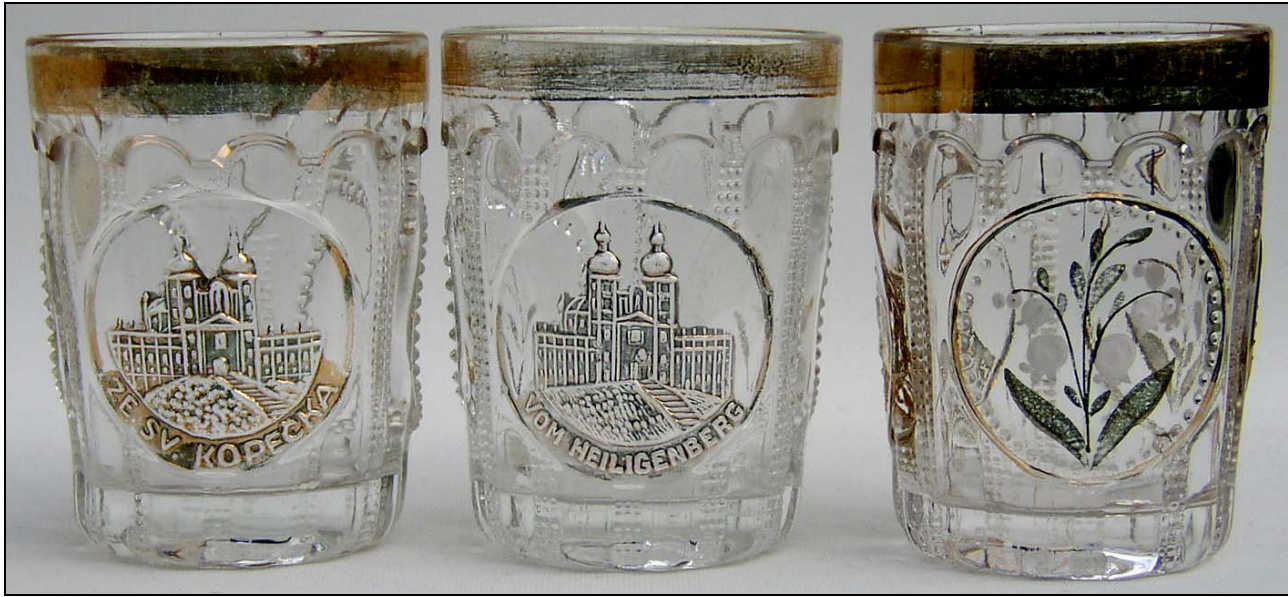
Abb. 2002-4/108b und PK Abb. 2012-2/46-xx

Becher mit Bild einer Wallfahrtskirche, eingepresste Inschrift „ZE SV. KOPEČKA“, farbloses Pressglas, H 9,8 cm, D 7,5 cm Becher mit Bild einer Wallfahrtskirche, eingepresste Inschrift „VOM HEILIGENBERG“, farbloses Pressglas, H 9,8 cm, D 7,5 cm Becher, Rückseite mit Maiglöckchen, eingepresste Inschrift „ZE SV. HOSTÝNA“, farbloses Pressglas, H 9,8 cm, D 7,5 cm Sammlung Geiselberger PG-069, PG-1114, PG-644 , Becher s. Preis-Kurant Pressglas Inwald 1914, Nr. 6383, „Walzenbrillant“