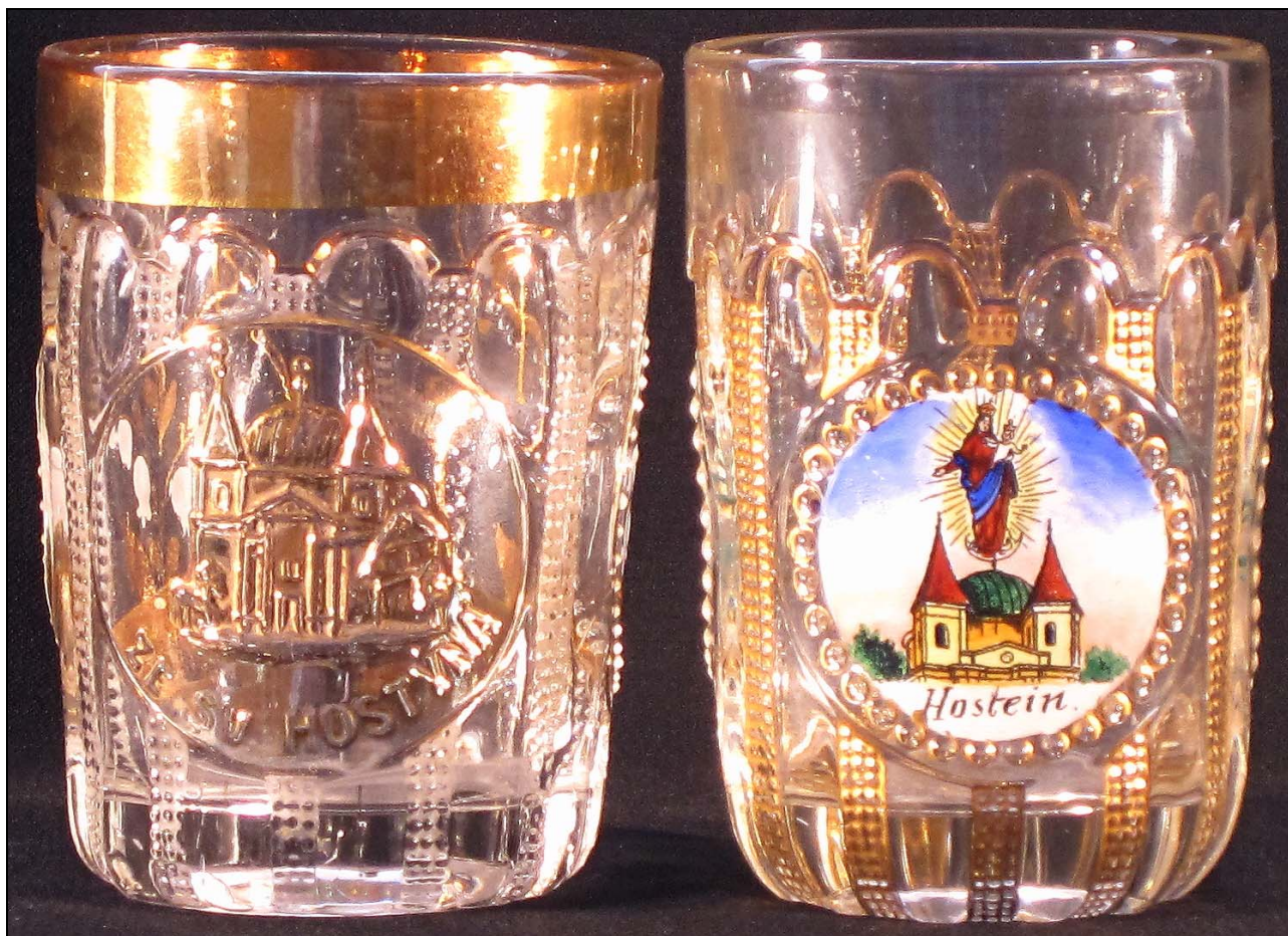
Abb. 2012-3/46-01 (Maßstab ca. 120 %)

Becher mit Bild einer Wallfahrtskirche, vergoldetes Bild und Inschrift „Ze Sv. Hostýna“ [Zum Hl. Hostein(berg)]