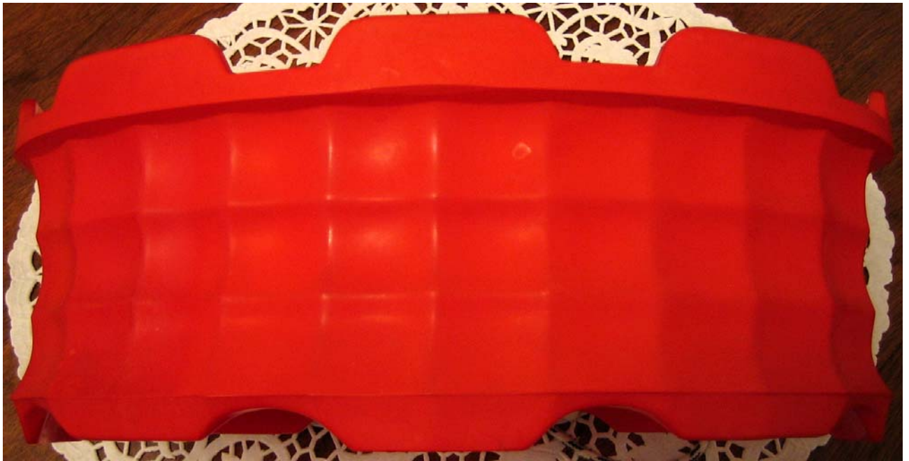
Abb. 2013-1/37-01 Ovales Stövchen mit Pseudo-Facetten, opak-rotes Pressglas, H 10,2 cm, B 16 cm, L 26,4 cm Sammlung Reisenberger Markierung innen : „D.R.G.M.“ und „DEPOSE“, s. MB Inwald 1940, Tafel 33, Nr. 8585 und Nr. 9549, Muster / Service „Lord“