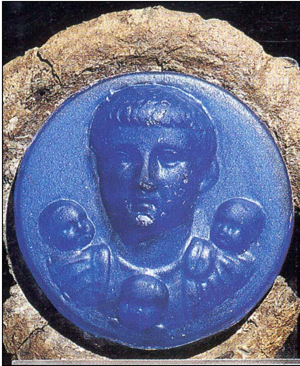
Abb. 2000-2/016 Medaillon des Kaisers Claudius (10 v. Chr.-54 n. Chr.) aus Harden 1988, S. 22 f. D 3,7 cm (Medaillon), Fassung Bronze 2. Viertel 1. Jhdt. n. Chr. 1963 in Colchester - Beverly Terrace, England, gefunden British Museum London

„ Opak-blaues Glas mit einer dünnen opak-weißen Schicht auf der Rückseite. In zwei Schichten formgegossen [...] Rundes unbeschädigtes Medaillon mit abgerundeten Kanten und Schleifspuren; Kopf des Mannes nachgearbeitet. [...] Keine Verwitterungsspuren. Einige kleine Blasen. [...] Die Medaillons wurden vermutlich in Serien von 9 Exemplaren als „ dona militaria “ (Ehrenzeichen) für Soldaten ausgegeben und als „ phalerae “ (Orden) auf dem Brustpanzer getragen. [...] Die in Bronze gefassten Glas-Medaillons waren von geringerem Wert [als die aus Silber oder versilberter Bronze] und wurden vermutlich in großen Mengen zur Verleihung an die unteren militärischen Ränge und an die Hilfstruppen hergestellt.“ [K.S.P. = Kenneth Painter] [SG: unter Claudius Eroberung Britanniens 43 n. Chr.]