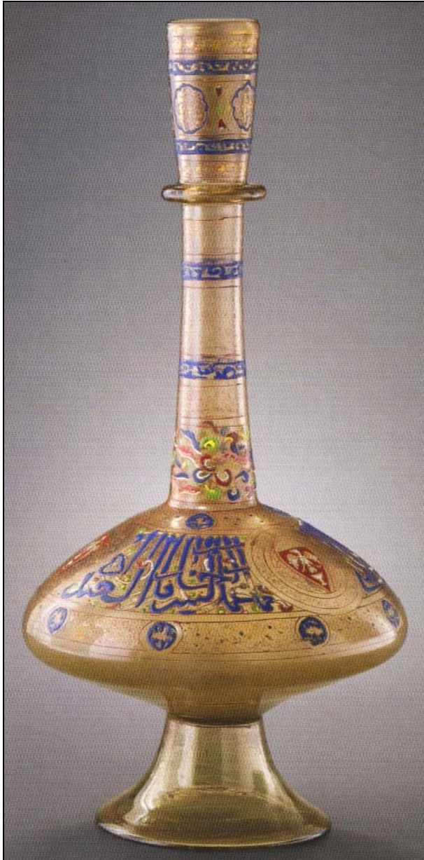
Abb. 2013-3/48-07 Flasche [Bouteille] geblasenes lustriertes, emailliertes Glas, H 51,1 cm, D 24,4 cm Syrien oder Ägypten, Mitte 14. Jhdt. Sammlung Louvre, Inv.Nr. OA 3110 bis aus AK „Arts de l’Islam du Louvre“, Paris 2012, S. 233, Ab. 144