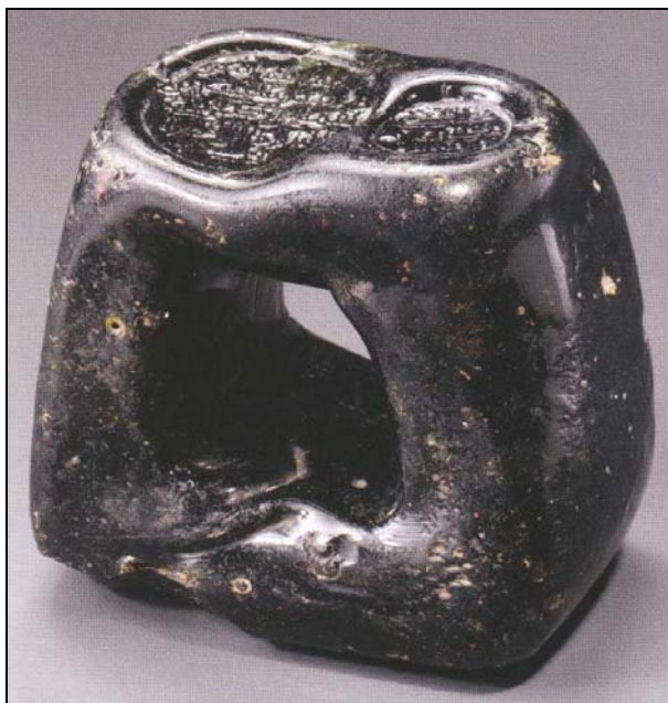
Abb. 2013-3/48-10 Gewicht als Ring [Poids annulaire] mit Inschrift gestempeltes opak-schwarzes Glas, L 8,1 cm, H 7,2 cm Ägypten 4. Viertel 8. Jhdt. Sammlung Louvre, Inv.Nr. aus AK „Arts de l’Islam du Louvre“, Paris 2012, S. 127/128