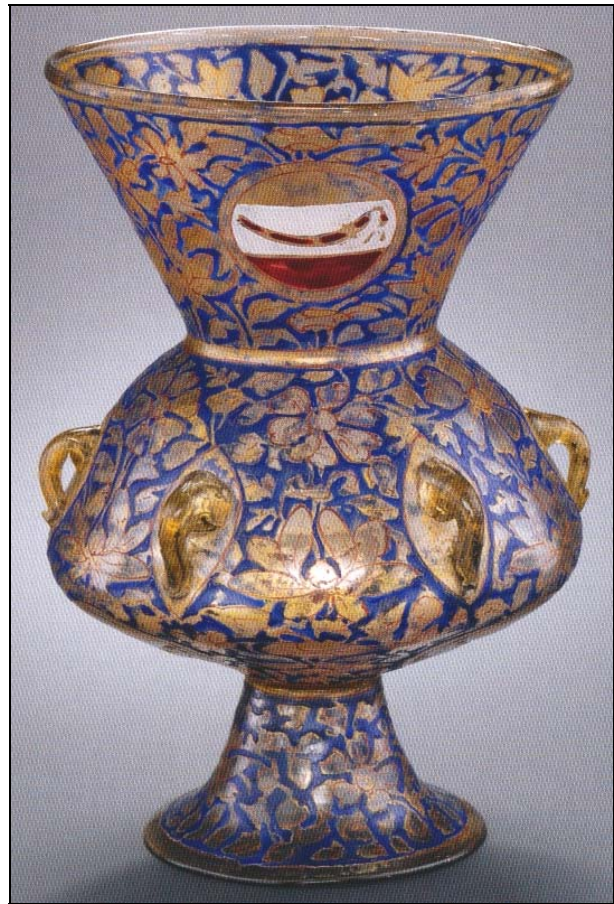
Abb. 2013-3/48-08 Moscheelampe mit Aufhängeösen Inschrift Sultan Barquq geblasenes lustriertes, emailliertes Glas, H 32,5 cm, D 27 cm Ägypten, Kairo, um 1386 Sammlung Louvre, Inv.Nr. OA 7568 aus AK „Arts de l’Islam du Louvre“, Paris 2012, S. 227, Ab. 138