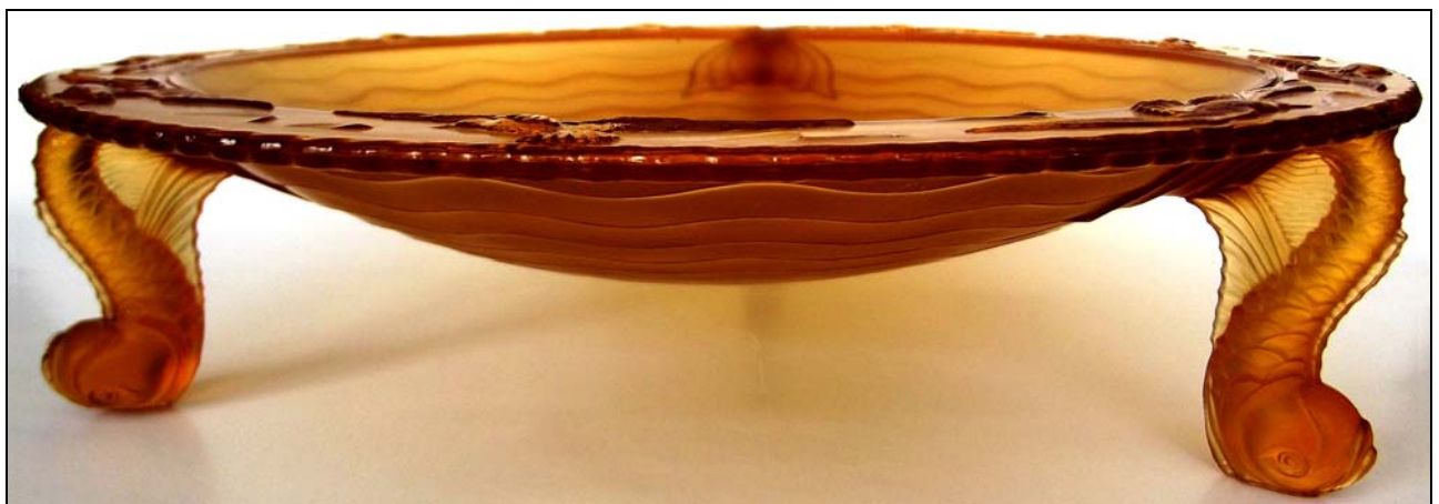
Abb. 2013-3/23-01 Runde, flache Schale mit drei Fischen als Füßen, Dekor am Rand 9 Vögel, Schale außen mit Wellenlinien bernstein-farbenes, mattiertes Pressglas, H 9 cm, D 36 cm Sammlung Gerlach s. MB S. Reich & Co. 1934, Tafel 76, Nr. 9021