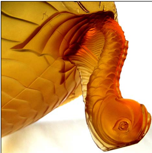
Abb. 2013-3/23-02 Runde, flache Schale mit drei Fischen als Füßen, Dekor am Rand 9 Vögel, Schale außen mit Wellenlinien bernstein-farbenes, mattiertes Pressglas, H 9 cm, D 36 cm Sammlung Gerlach s. MB S. Reich & Co. 1934, Tafel 76, Nr. 9021

In den vollständig erhaltenen MB Böhm. Kristallglas & Pressglas, Libochovice, um 1930 - 1939, und Catalogue No. 316, Verre pressé, Glassexport / Libochovice, 1934 / 1949, ist diese Schale nicht zu finden.