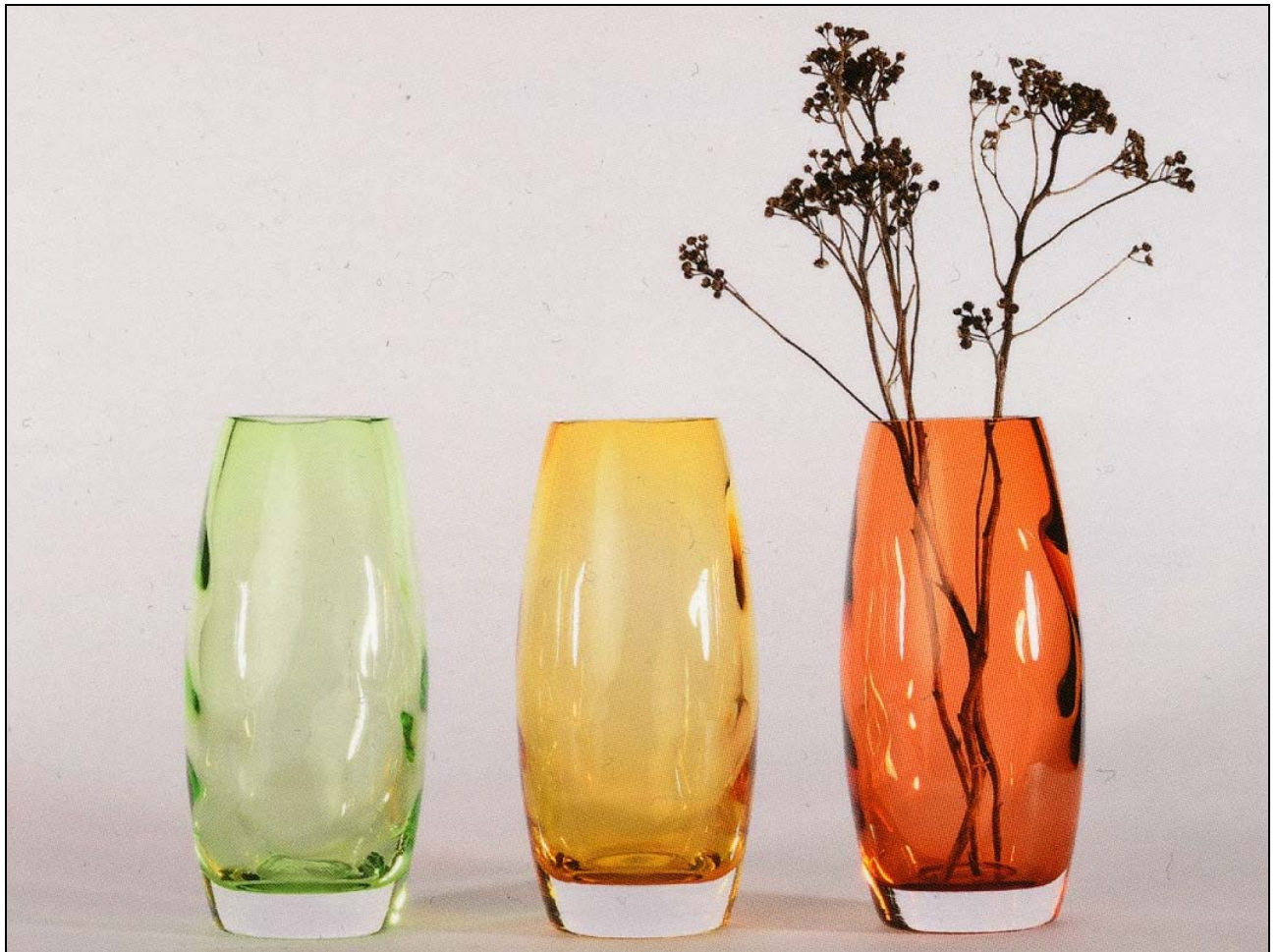
Abb. 2013-3/51-01 Drei Vasen, Andreas Brandolini, Centre International d' Art Verrier Meisenthal