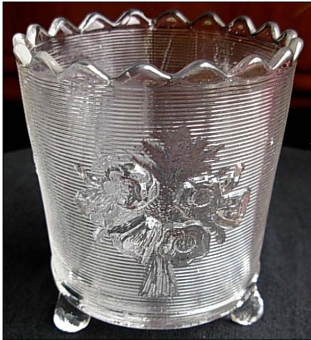
Abb. 2010-2/060 Vase mit Blumen-Buketts, waagerechte Rillen farbloses Pressglas, H 8 cm, D 7 cm eBay FR im Boden eingepresste Marke „DEPOSÉ BAYEL“ SG: s. MB Bayel / Clairey 1886, Planche 59, Vase Nr. 401