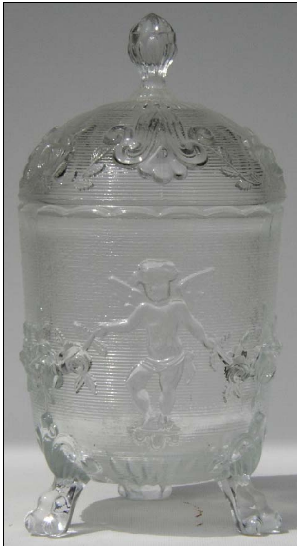
Abb. 2010-2/002 neu →

s. MB Atlantis 2009, Tafel 172, Deckeldosen Querubin, Engel mit Rosen