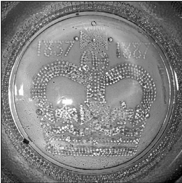
Abb. 2009-1/045 Butterschale (Deckel fehlt), königliche Symbole aus Punkten im Boden Krone mit den Jahren „1837“ und „1887“ farbloses Pressglas, H 6 cm, D 13 / 18 cm Sammlung Hott zum 50. Regierung-Jubiläum Queen Victoria 1837-1887 keine Marke George Davidson & Co., Gateshead-on-Tyne, England, 1887