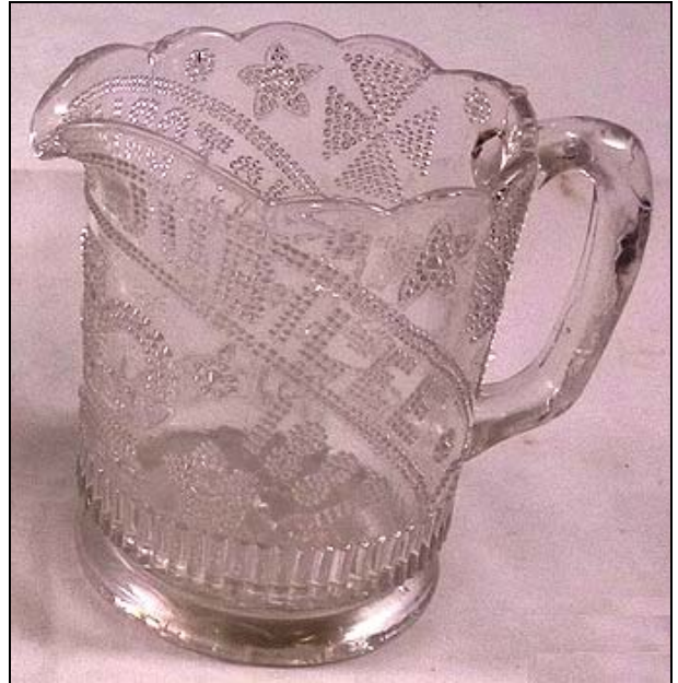
Abb. 2013-3/03-02 Sahnekännchen „QUEEN VICTORIA'S JUBILEE“ 1887 farbloses Pressglas, H xxx cm, D xxx cm Auktion Kivells, Devon, England, 28. Juni 2013, Los 165 Hersteller unbekannt, England