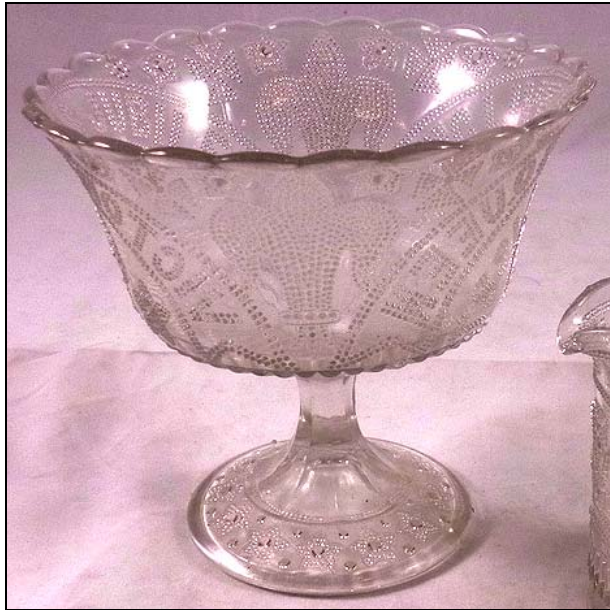
Abb. 2013-3/03-01 Fußschale „QUEEN VICTORIA'S JUBILEE“ 1887 farbloses Pressglas, H xxx cm, D xxx cm Auktion Kivells, Devon, England, 28. Juni 2013, Los 165 Hersteller unbekannt, England

Diese beiden Gläser, Fußschale und Sahnekännchen, werfen die Frage neu auf, wer der Hersteller dieser Gläser war. Die beiden gehören sicher zusammen und waren wahrscheinlich ebenso Teile eines Service mit mehreren Teilen, wie die bisher in der PK abgebildeten Stücke Butterdose (ohne Deckel), PK Abb. 2009-1/044, Sammlung Hott, Sahnekännchen Sammlung Joyce, PK Abb. 2010-1/061 , sowie Fußschale und ovale Platte, Sammlung Wessendorf, aus www.pressglas-pavillon.de , Nr. 05897 und Nr. 08480 . Gemeinsam haben die bisher dokumentierten Stücke, dass Schrift und königliche Symbole aus Reihen von feinen Punkten gebildet wurden, aber die verwendeten Symbole und die eingepressten Inschriften unterscheiden sich: bei der Fußschale Sammlung Wessendorf läuft die Schrift wagrecht um den unteren Rand der Kupa, bei den neu aufgetauchten Stücken ist die Inschrift in einem breiten gebogenen Band mit Schwalbenschwanz . Beim Sahnekännchen ist sie von außen lesbar „ VICTORIA'S JUBILEE “ und „ 1837 “, bei der Fußschale ist sie von innen lesbar und ist ergänzt mit „ ??? QUEEN “!