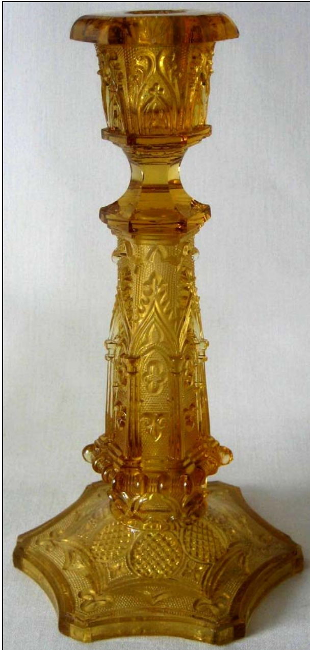
Abb. 2013-1/63-01 und Abb. 2013-1/63-02 Leuchter mit neu-gotischem Muster bernstein-farbenes Pressglas, H 25 cm, D 13,5 cm Sammlung Vogt PV-1522 s. MB Launay, Hautin & Cie., um 1840, Planche 50 No. 1790 B. (9 ½, 10), Flambeau m. Sablée Gothique, Baccarat 1840

nach Baccarat oder St. Louis hergestellt, da aber auch hier Musterbücher nicht zugänglich sind, können solche Kopien nicht nachgewiesen werden. Die beiden belgischen Konkurrenten haben aber Pressglas in einer Qualität hergestellt, die der von Baccarat und St. Louis gleichgekommen ist. Die beiden oben dokumentierten Leuchter liegen weit darunter!