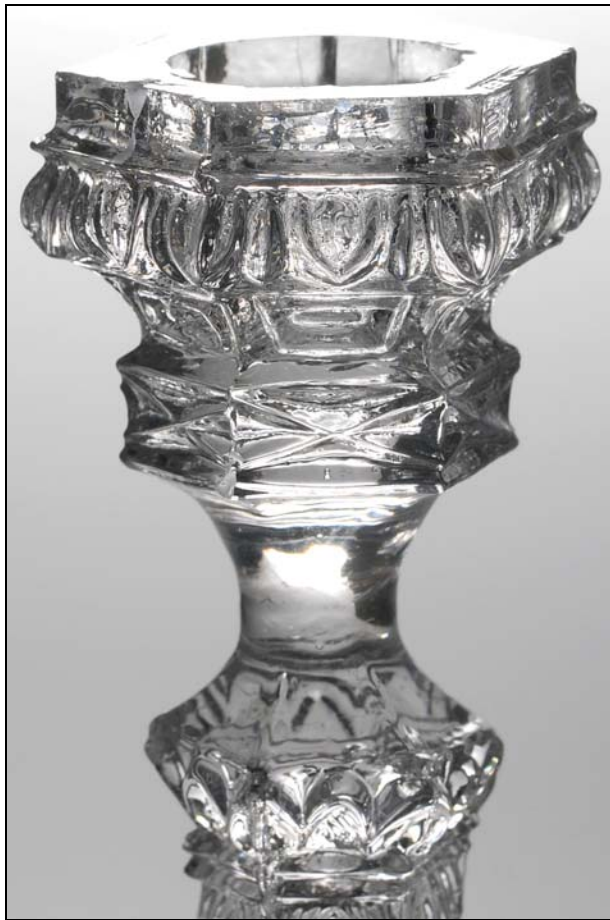
← Abb. 2013-3/07-03

Leuchter mit neu-gotischem Muster farbloses Pressglas, H 16,4 cm, D max 9,2 cm, G 224 g Standfläche und Tülle flach geschliffen und poliert vgl. Abb. 2013-1/63-03, Sammlung Vogt PV-1523 bernstein-farbenes Pressglas, H 15,8 cm, D ??? cm, G 223 g Hersteller unbekannt, nach 1850