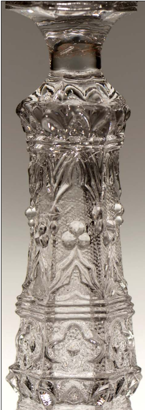
Abb. 2013-3/07-02 Leuchter mit neu-gotischem Muster farbloses Pressglas, H 16,4 cm, D max 9,2 cm, G 224 g Standfläche und Tülle flach geschliffen und poliert vgl. Abb. 2013-1/63-03, Sammlung Vogt PV-1523 bernstein-farbenes Pressglas, H 15,8 cm, D ??? cm, G 223 g Hersteller unbekannt, nach 1850