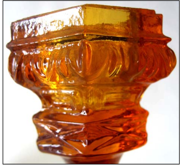
Abb. 2013-1/63-04b, Leuchter mit neu-gotischem Muster, bernstein-farbenes Pressglas, H 15,8 cm, D ??? cm Sammlung Vogt PV-1523, Hersteller unbekannt, nach 1850

Leuchter mit neu-gotischem Muster bernstein-farbenes Pressglas, H 15,8 cm, D ??? cm Sammlung Vogt PV-1523 Hersteller unbekannt, nach 1850