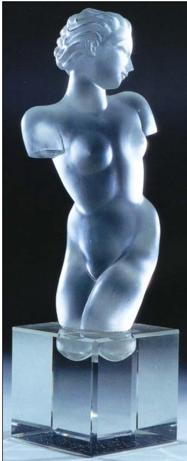
Abb. 2013-3/12-02 Kat.Nr. 262, TORSO, um 1935 Farbloses Glas, gepresst, mattiert, Sockel aus poliertem Kristallglas Entwurf von Eleon von Rommel, Berlin Produktion Josef Riedel, Polaun, für die Kollektion „Ingrid“ der Firma Curt Schlevogt, Gablonz H 29 cm, Sammlung MSB Jablonec, Inv.Nr. S 1786 Literaturangaben Katalog Schlevogt o. J., S. 8, Muster Nr. 1058