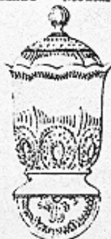
Senfkanne — Montardier