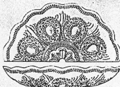
Lochschale — Coupe percée pour pied métal