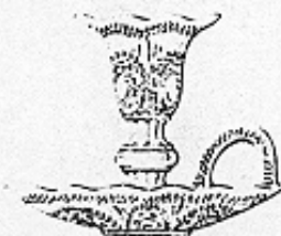
Handleuchter — Bougeoir