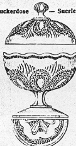
Zuckerdose — Sucrier