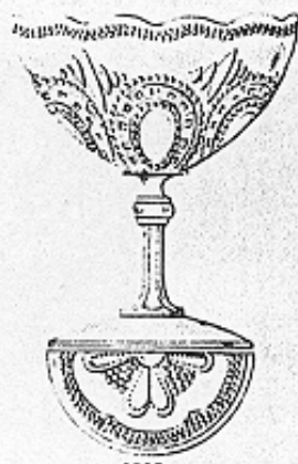
Zuckerschale — Coupe à sucre