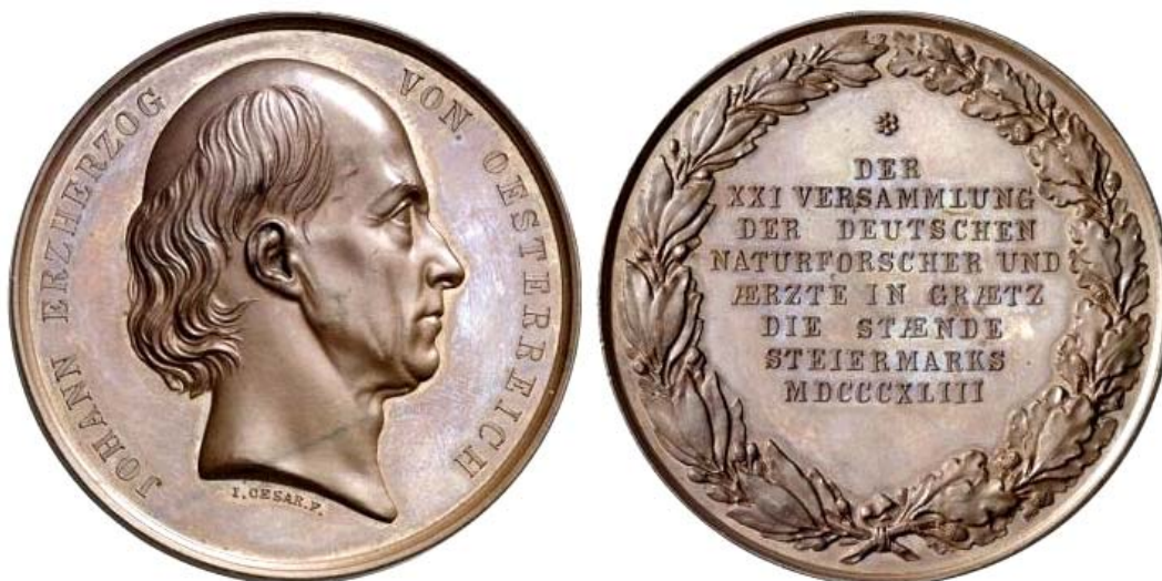
Abb. 2014-1/18-06 (Maßstab ca. 125 %) aus http://www.mcsearch.info / Numismatik Lanz München ... (2014-02) Bronzemedaille 1843 (J. Cesar) auf die 21. Versammlung der deutschen Ärzte und Naturforscher in Graz, gewidmet von den Ständen der Steiermark. Avers: Kopf rechts. Inschrift: „JOHANN ERZHERZOG VON OESTERREICH“ Revers: Zwischen Lorbeer- und Eichenzweig Inschrift in acht Zeilen „... MDCCCXLIII (1843). Wurzb. 4011, Horsky 3590, Brettauer 2415. 54,37g. 50 mm. Stempelglanz.

http://de.wikipedia.org/wiki/Geschichte_der_Steiermark (mit Wappen) http://de.wikipedia.org/wiki/Johann_von_Österreich http://www.erzherzogjohann.steiermark.at/cms/beitrag/11067636/37757845 http://www.mcsearch.info/record.html?id=48218 http://www.mcsearch.info/record.html?id=10795 http://www.mcsearch.info/record.html?id=6602