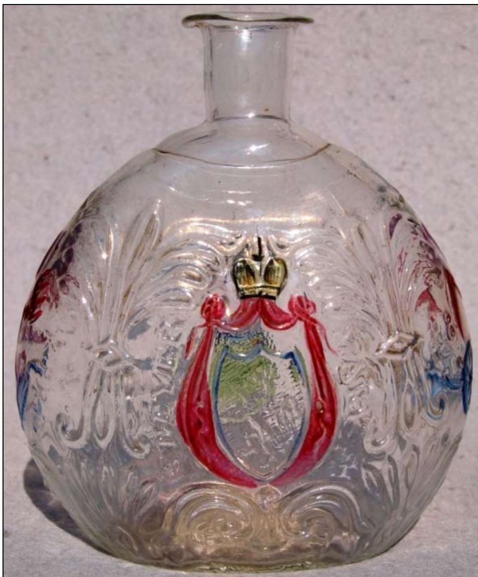
Abb. 2014-1/18-03; links: Tschuttera Erzherzog Johann, form-geblasenes, farbloses Glas, bunt bemalt, 2 Formnähte, H 15 cm Aufschrift: „ E-HERZOG JOHANN “, Pflug, Rechen, Sense und Dreschflügel, Jahreszahl „ 1840 “ Emblem aus Gabeln, Spaten, Säge, Messer, Aufschrift: „ GLASFAB. D. B. V. K. K. PRIV. “, Wappen Panther & „ STEYERMARK “ Benedikt Vivat, Langerswald, Herzogthum Steyermark, 1840, aus AK Eibiswald 1978, Kat.Nr. 92 und Kat.Nr. 97