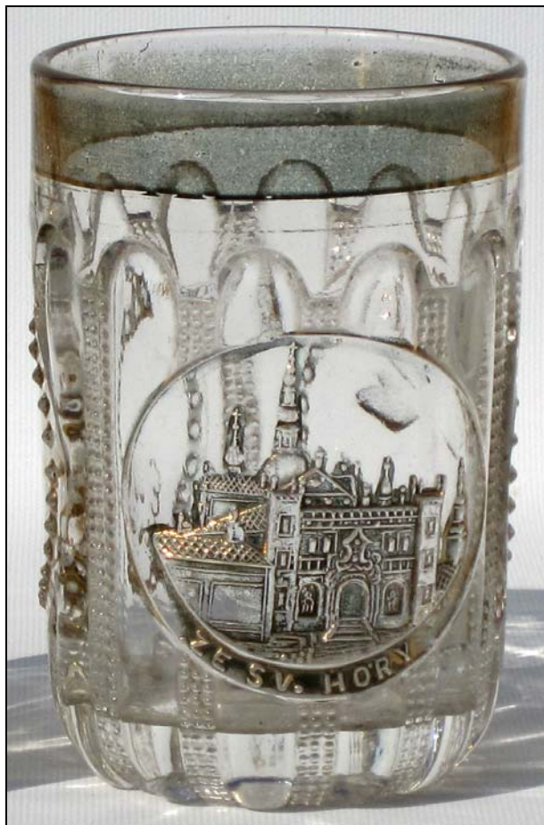
Abb. 2014-1/37-03 (Maßstab ca. 100 %) Becher mit Bild der Wallfahrtskirche Svatá Hora bei Příbram, Eingangstor , eingepresste Inschrift „ ZE SV. HORY “, farbl. Pressglas, Gebäude - Rand vergoldet, H 9,9 cm, D 7,6 cm rückseitig 2 Medaillons ohne Bemalung Sammlung Maierholzner Grundform Becher s. Preis-Kurant Pressglas Inwald 1914, Nr. 6383, „Walzenbrillant“

ren Verkündigung viele Kirchen auf Berge. Schon am Stil sieht man von weitem, dass diese Kirchen im Barock und Rokoko entstanden sind, z.T. auch nach Zerstörungen durch den Krieg wieder aufgebaut.