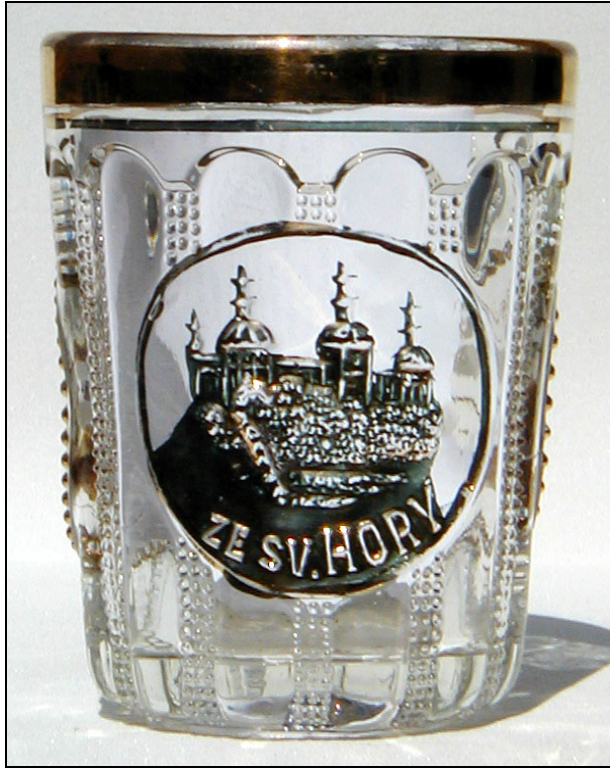
Abb. 2002-4/105 Becher mit Bild der Wallfahrtskirche Svatá Hora bei Příbram eingepresste Inschrift „ ZE SV. HORY “, Gebäude - Rand vergoldet, farbl. Pressglas, H 9,7 cm, D 7,6 cm Sammlung SG PG-067 (jetzt Glasmuseum Passau) rückseitig 2 runde Medaillons mit handgemalten Maiglöckchen Grundform Becher s. Preis-Kurant Pressglas Inwald 1914, Nr. 6383, „Walzenbrillant“