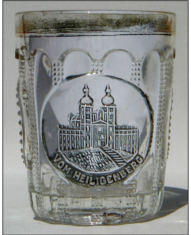
Abb. 2002-4/107 Becher mit Bild der Wallfahrtskirche Swatý Kopeček bei Olomouc , eingepresste Inschrift „ VOM HEILIGENBERG “ rückseitig 2 runde Medaillons mit abgewetzten Bildern farbl. Pressglas, Gebäude - Rand vergoldet, H 9,8 cm, D 7,5 cm Sammlung SG PG-069 (jetzt Glasmuseum Passau) Grundform Becher s. Preis-Kurant Pressglas Inwald 1914, Nr. 6383, „Walzenbrillant“